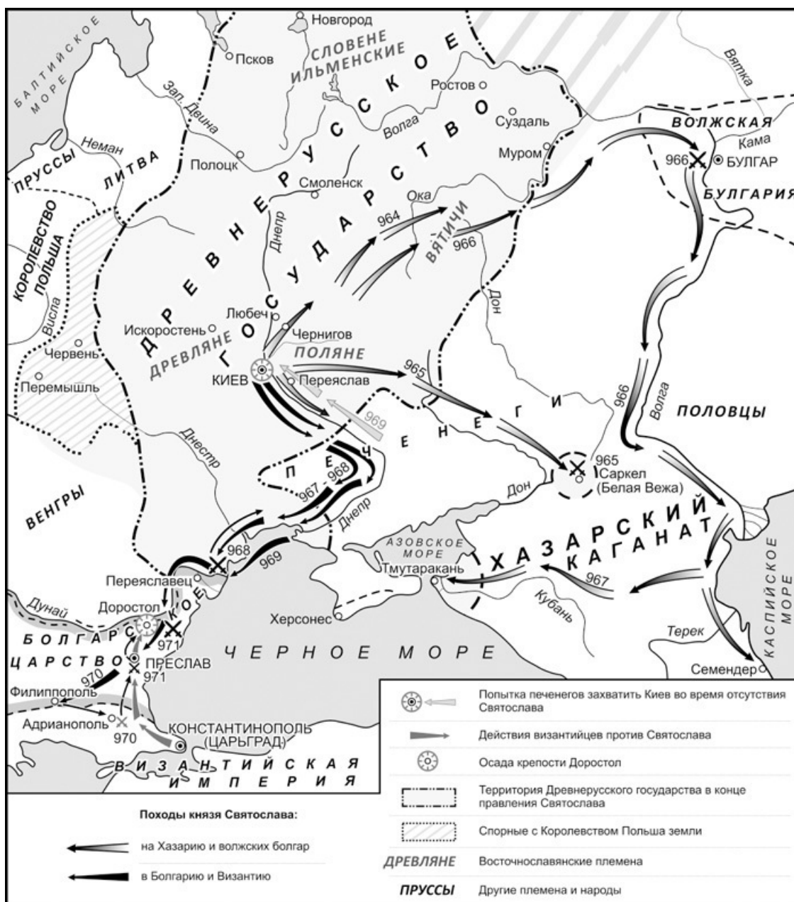
Все походы Святослава во всех направлениях

Впрочем, византийцы гарантировали князю и его войску безопасное возвращение домой через печенежские степи. Ирония судьбы, но именно от рук печенегов и был убит Святослав близ устья р. Днепр в 972 г. Судя по летописям, его предупреждал об опасности воевода Свенельд , но почему-то князь всё равно решил зимовать за пределами границ Руси. По легенде, из черепа Святослава печенежский хан Куря сделал себе чашу, из которой попивал разные жидкости, чтобы получить силу русского князя. Историки видят во всём этом византийский след – мол, хитрые византийцы обманули русичей и на самом деле подкупили печенегов, чтобы те устроили засаду. Летописи говорят, что причиной смерти князя стало его язычество, – мол, не слушался маму-христианку, вот и напоролся. Вполне возможно, что Святославу просто не повезло.