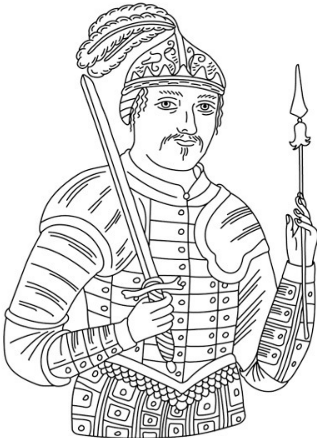
Молодо выглядящий для своих лет князь Игорь

В это же время в южных степях объявился новый опасный сосед – печенеги. Этот кочевой тюркский народ пришёл из Средней Азии, выталкивая перед собой венгров, и осел в северном Причерноморье. Но Игорю удалось договориться, и какое-то время друг друга никто не трогал. Русские поселенцы даже преодолевали степи и основывали поселения в Крыму и в устье Днепра.