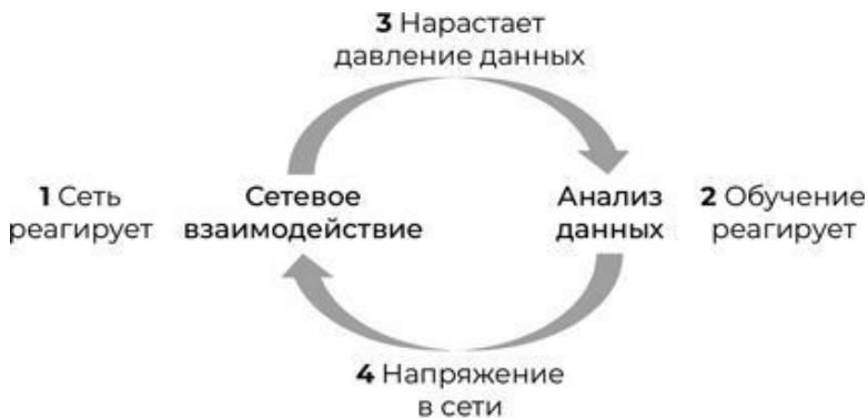
Рис. 1.2. Двойная спираль сетевого взаимодействия + анализа данных

ности имеют ограниченный эффект, однако за счет взаимодействия общества мы добиваемся бурного развития, идя семимильными шагами вперед. В человеческой цивилизации ключевым элементом является не отдельный индивид, а растущие день ото дня возможности взаимодействия всего общества в целом. Это и есть самое важное преимущество нашей эпохи.