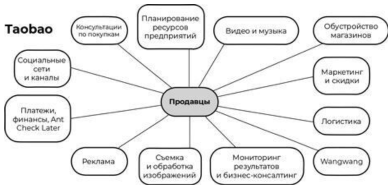
Рис. 1.3. Сеть взаимодействия продавцов на Taobao

ми. Например, каждый день на Taobao производят покупки более 100 млн человек. Каждый из клиентов просматривает различные товары. Обработать подобный массив информации и принимать сложные управленческие решения под силу только машинам. Здесь весьма показателен вопрос: можете ли вы целиком передать функции сотрудников машинам? Если ответ положительный – вы совершите качественный скачок по направлению к умному бизнесу.