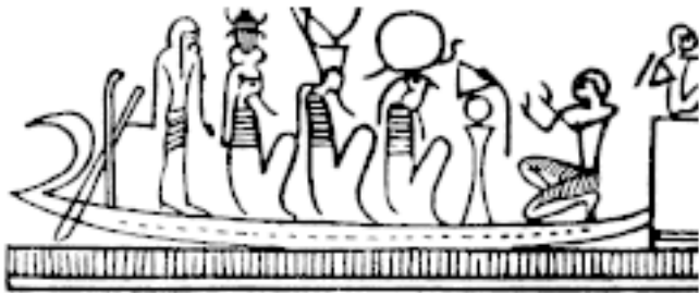
Рис. 4. Корабль Ра. Книга мертвых. Эпоха Птолемеев (?)

Внутри храма также хранился как сокровище божественный символ в виде небольшого обелиска, который назывался бенбен ; он был сделан, возможно, из камня, и по его названию храм получил свое имя Хат Бенбен, Дом Обелиска или, скорее, «пирамидальная вершина обелиска» – это название особенно любили использовать в религиозных и магических текстах. Этот бенбен считался воплощением самого Ра. Выбор неодушевленного предмета с этой целью можно проследить во влиянии азиатских идей, как будет показано позже. Стоит отметить, что в Гелиополе этот культ можно обнаружить не только в самые древние времена, он продолжал существовать и на протяжении всей истории Египта. Это тем более поразительно, потому что поклонение фениксу, как второму воплощению бога Ра, также преобладало в Гелиополе, и это была чисто египетская концепция. Тесная связь между Гелиополем и Азией, по-видимому, была еще в доисторические времена и существовала долго: о ней зна-