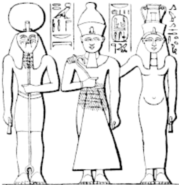
Рис. 6. Рамсес II между Гармакисом и Иу-с-аас. Храм в Герф-Хусейне

Гер-Нуб , Золотой Гор, является в первую очередь богом восходящего солнца, проявляющимся в золотом великолепии зари. Поэтому его можно считать в каком-то смысле двойником Золотой Хатхор. Золотая Хатхор не была никак связана с греческой Золотой Афродитой, а была богиней западного неба, которая принимала умирающее солнце в заре-ве заката, и поэтому должна была также принимать мертвых