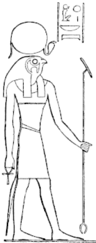
Рис. 5. Ра. Стела Сети I

Сам Ра, который в надписях обозначается как бог Гелио-