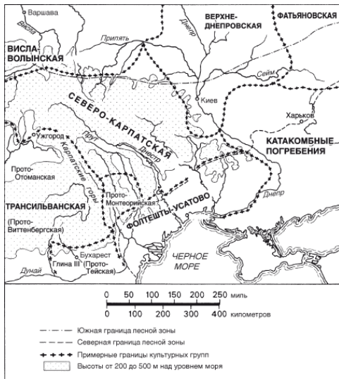
Рис. 3. Районы распределения курганов северокарпатского типа и соседней более поздней шнуровой керамики в первой половине второго тысячелетия до н. э.

Чешский славист Любор Нидерле, автор «Славянских древностей» (1902), разместил праславян в среднем и верхнем течении Днепра. Однако мнение Нидерле о том, что родина славян – верхнее течение Днепра, не подтверждается топонимикой. Названия рек и археологические разыскания показывают связь с балтийской культурой.