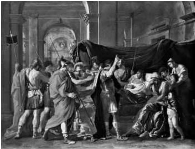
Смерть Германика. Картина Николая Пуссена. 1627 г.

гула и Тиберию, в чье правление обвалился битком набитый людьми амфитеатр в Фиденях. Завидовал – и страстно мечтал о большом военном походе, о лютом голоде, об эпидемии чумы, о страшных пожарах или разрушительных землетрясениях.