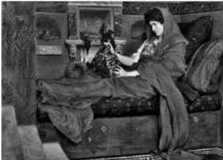
Агриппина с прахом Германика. Л. Альма-Тадема.

Своего брата Тиберия Калигула казнил, обвинив его в том, что он тайно принимает противоядие, словно опасаясь, что император прикажет его отравить. На самом деле Тиберий принимал лекарство от мучившего его постоянного кашля.