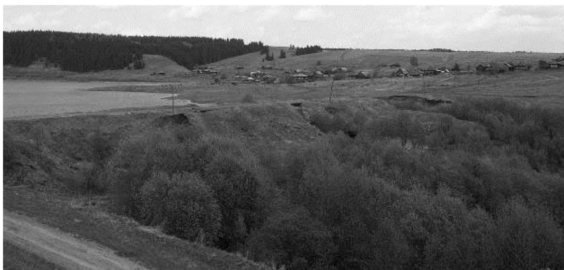
Современный вид на плотину, май 2008 года.

Новый посёлок застраивался при прямой планировке улиц, причем западная часть – широкими параллельными улицами, а восточная – улицами разных направлений, соответственной рельефа местности. Дома не были однообразными, а имели каждый своё лицо. Дворы были