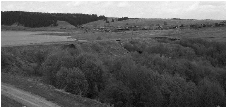
Современный вид на плотину, май 2008 года.

Новый посёлок застраивался при прямой планировке улиц, причем западная часть – широкими параллельными улицами, а восточная – улицами разных направлений, соответствующей рельефа местности. Дома не были однообразными, а имели каждый своё лицо. Дворы были всегда крытыми. Здесь надо заметить, что пилы появились на Урале в 1840-х годах, значит, все строилось без пил, одним топором.