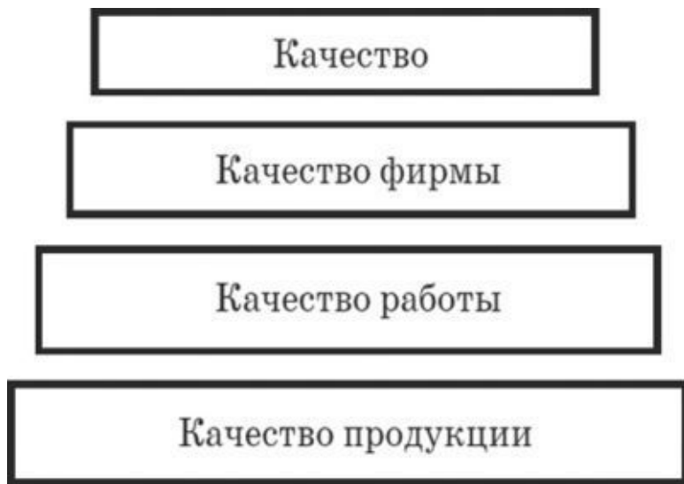
Рис. 1.1. Пирамида качества

Качество – это авторитет фирмы, увеличение прибыли, рост процветания, поэтому работа по управлению качеством фирмы является важнейшим видом деятельности для всего персонала, от руководителя до конкретного исполнителя. Качество можно представить в виде пирамиды (рис. 1.1).