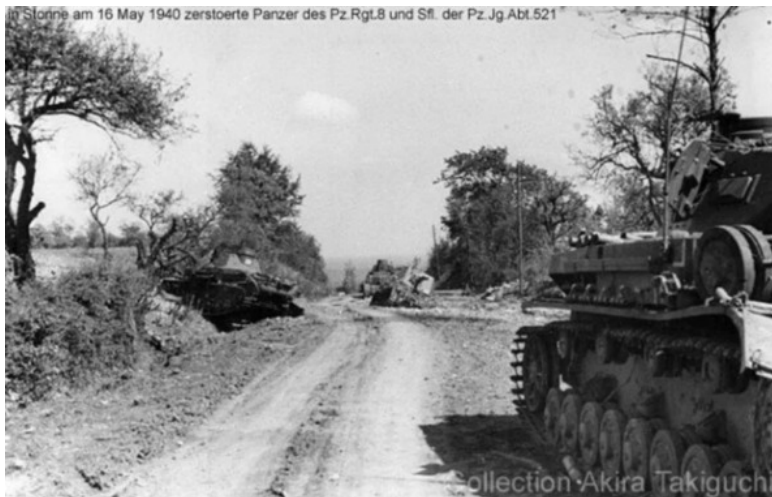
Фото из немецкого архива. Как видно по подписям – это подбитые немецкие танки 10-й дивизии у деревни Стонне.

Бои за деревню Стонне шли четыре дня, с французской стороны участвовала 3-я танковая (3e division cuirassée) и 3-я мотопехотная (3e division d'infanterie motorisée) дивизии, с немецкой – 10-я танковая дивизия (10. Panzer-Division) и полк «Великая Германия» (Infanterie-Regiment Grossdeutschland). В ходе боёв Стонне действительно несколько раз переходила из рук в руки, но не 17—19 раз, а раза 4—5.