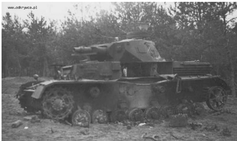
Фото подбитого танка PzKpfw. IV, которым (как