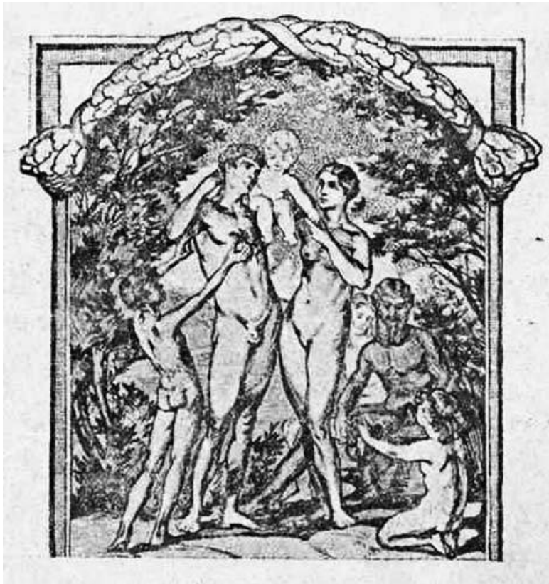
Эмблема евгеники Евгенического отдела Московского Музея Социальной Гигиены