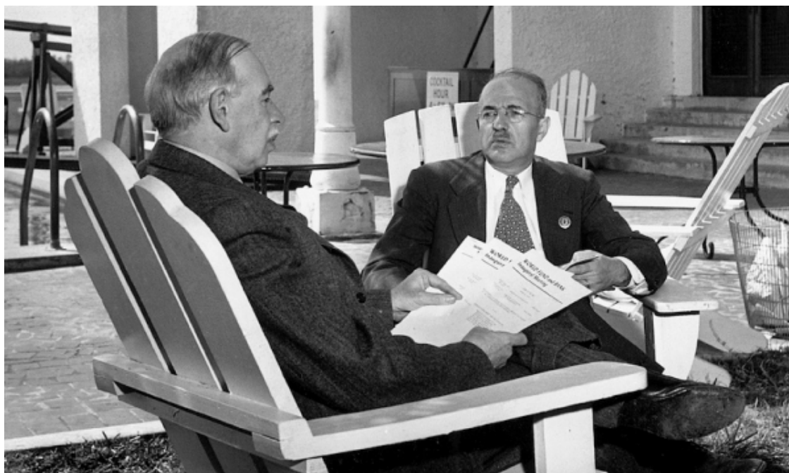
Джон Кейнс и Гарри Уайт в кулуарах Конференции

Обычно в учебниках говорится о том, что на Конференции обсуждались проекты послевоенного валютно-финансового устройства, представленные американской и английской делегациями (соответственно – Гарри Уайтом и Джоном Кейнсом). Проект Кейнса предлагал создание наднациональной валюты, называемой «банкром». Она должна была обслуживать большую часть международных расчетов. Эмиссия банкора и расчеты должны были осуществляться через Международную клиринговую палату, которая также имела бы наднациональный статус.