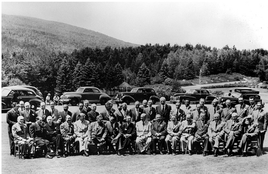
Участники Конференции в Бреттон-Вудсе

Для тех, кто изучал экономику (особенно мировую экономику), слово «Бреттон-Вудс» хорошо знакомо. В любом учебнике по экономической теории, международным экономическим отношениям, деньгам и кредиту, экономической истории и т. п. обязательно упоминается конференция в Бреттон-Вудсе. В зависимости от целей учебника и его формата дается более или менее подробное описание основных параметров бреттон-вудской валютно-финансовой системы. В наиболее фундаментальных учебниках раскрываются предпосылки формирования бреттон-вудской системы (БВС), причины ее кризиса и развала. Но даже в самых солидных учебниках многие «тонкости» и детали вопросов, касающихся БВС, остаются «за кадром».