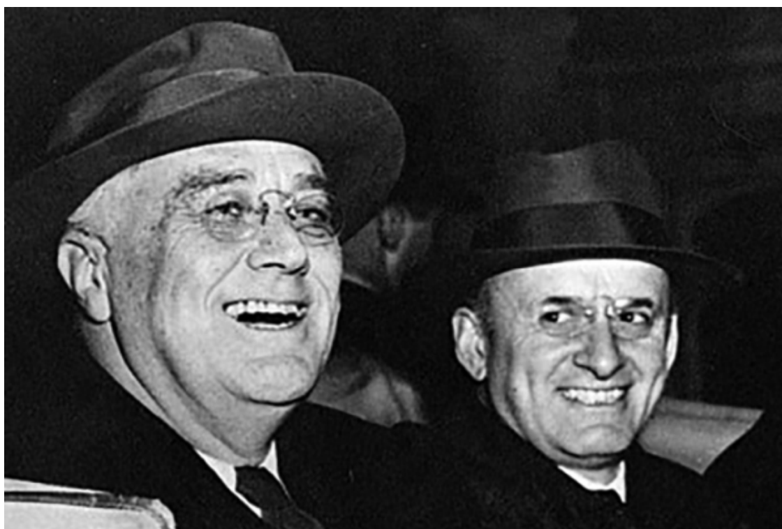
Ф. Д. Рузвельт и Генри Моргентау

Бреттон-Вудская конференция – очень даже видимое и значимое событие в мире финансов. Видимая часть этого события уже давно описана. А дальше происходило и до сих пор продолжается лишь механическое переписывание (причем нередко при таком переписывании возникают неточности и даже ошибки). Автор попытался разобраться в некоторых закулисных политических и межличностных хитросплетениях, которые предвосхищали и сопровождали конференцию 1944 года. Героями этих хитросплетений были американский президент Франклин Рузвельт, министр финансов США Генри Моргентау, высокопоставленный чиновник министерства финансов Гарри Уайт, Председатель Совнаркома СССР И. В. Сталин, английский экономист Джон М. Кейнс и многие-многие другие. Зарубежные авторы, выпускавшие монографии по Бреттон-Вудсу детально обсуждают роль перечисленных выше и многих других фигур в построении послевоенной мировой финансовой системы.