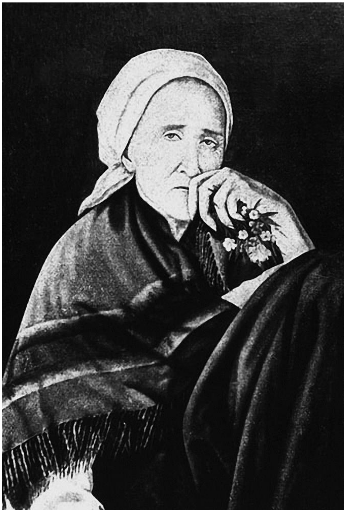
Пелагия Дивеевская (1809–1884) Первая из трех канонизированных блаженных Серафимо-Дивеевского монастыря