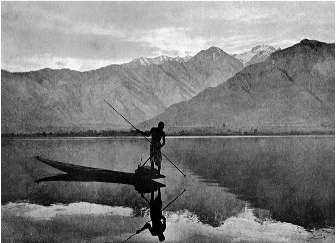
Озеро Дал в Кашмире