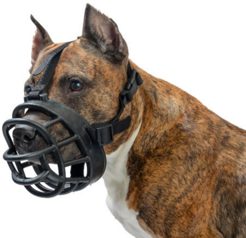
Рисунок 3: Вполне вероятно, что вам понадобится намордник для собак этой породы.

Прежде чем завести собаку, нужно подумать о том, какая утварь принадлежит собаке. Основное снаряжение включает один или два поводка, нагрудную шлейку, корзину и одеяла, миски для еды и воды, игрушки, щетки и, в случае американского стаффордшира, намордник или два намордника. В финансовом плане вам также необходимо учесть расходы на корм для животных, прививки и регулярные визиты к ветеринару. Не забывая о страховании ответственности собак и налоге на собак.