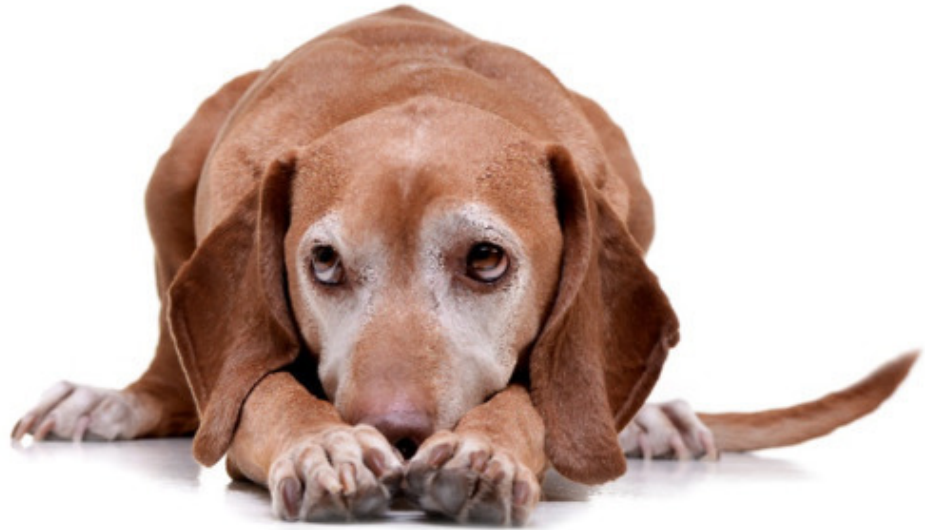
Рисунок 6: Щенок делает себя очень маленьким.

Иногда они пытаются лизнуть лицо вышестоящей собаки или сиделки. В более экстремальных ситуациях они полностью ложатся на спину, обнажая горло.