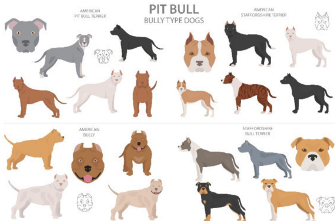
Рисунок 1: Различные типы

Сегодня в Германии американских стаффордширов держат в основном как семейных и сторожевых собак, и они очень ценятся. Интересно, что их также используют в качестве собак для терапии и спасательных операций, и там они могут продемонстрировать свои навыки. Они подходят к выполнению своих задач с энтузиазмом и настойчивостью.