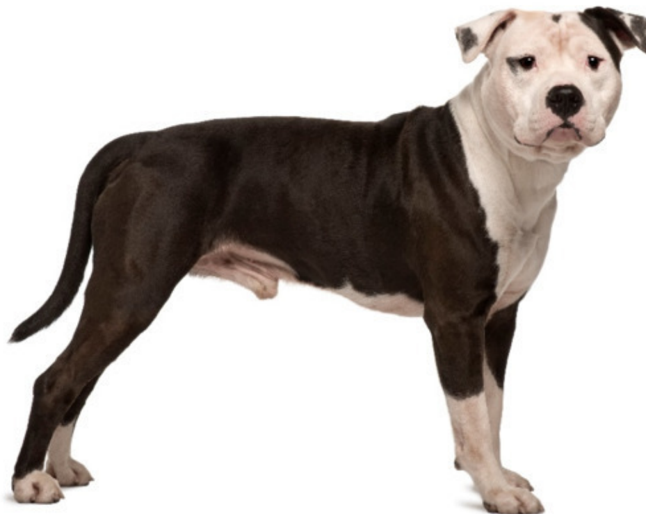
Рисунок 2: Амстафф