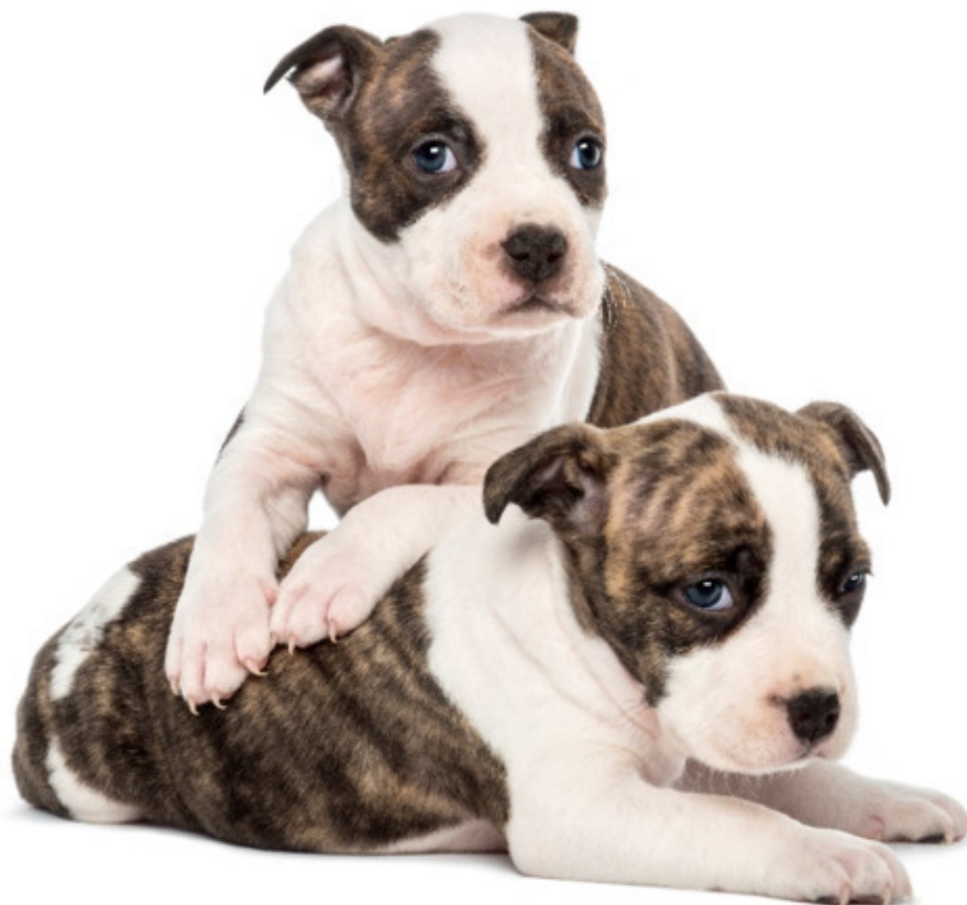
Рисунок 4: Милые маленькие щенки амстаффа

Дрессировка начинается сразу после того, как щенок поселится в доме. Она должна выполняться последовательно.