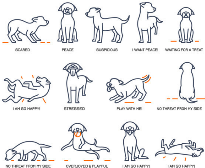
Рисунок 5: Распознавание языка собак.