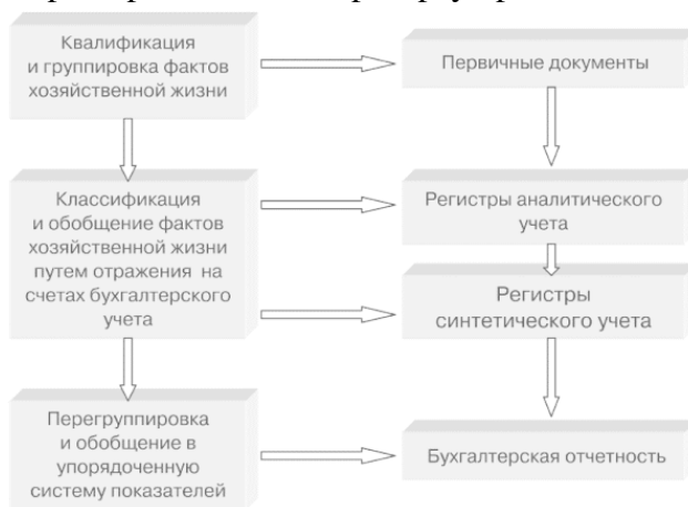
Рис. 1. Этапы обобщения учетной информации

Отличительной чертой бухгалтерской отчетности является балансовый принцип взаимосвязи ее показателей. Этот принцип вытекает из двойной записи данных на счетах, показатели которых составляют основу отчетности. Из этого следует, что бухгалтерская отчетность – это упорядоченная взаимосвязанная система показателей, характеризующих условия и результаты хозяйственной деятельности. Балансовый принцип построения бухгалтерской отчетности усиливает ее комплексный характер и облегчает проверку правильности отчетности.