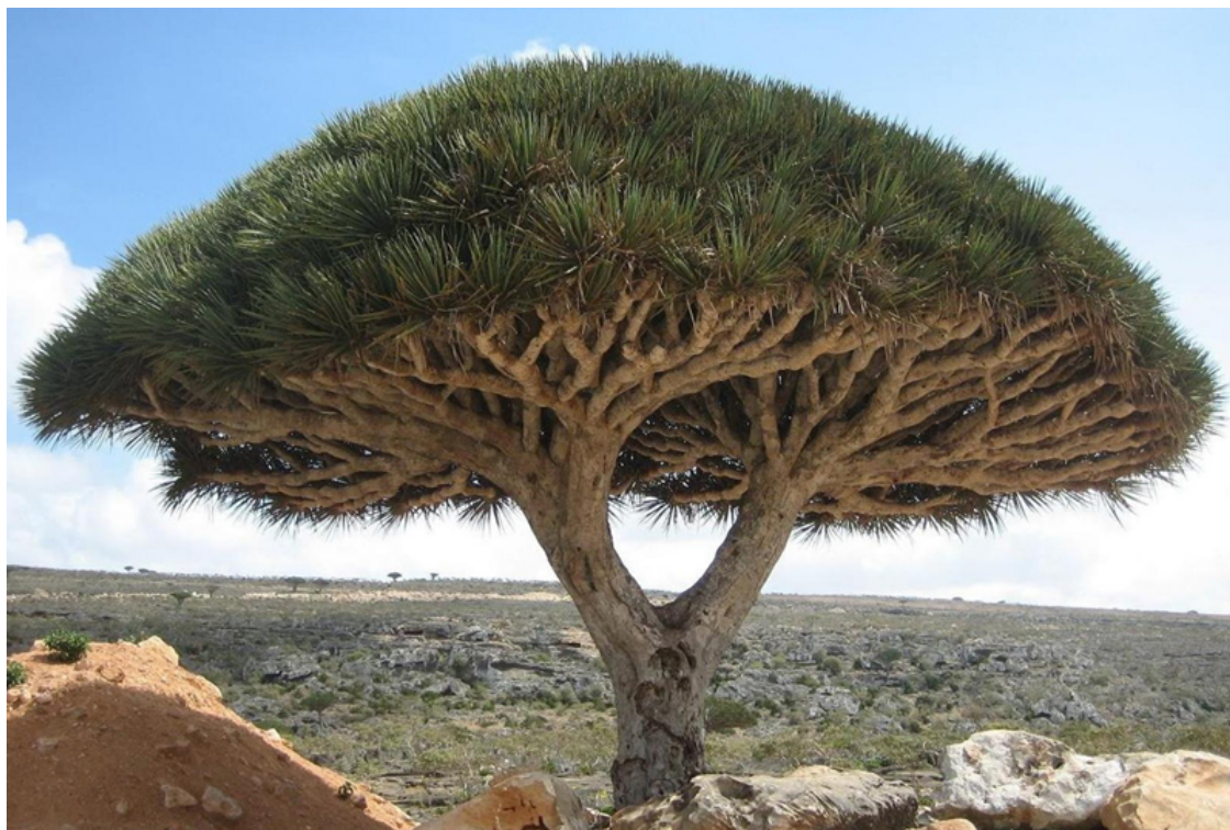
Драконово дерево, символ островов

А что, если этот лишайник связан с тайной производства тирского пурпура? Кроме орсея, на Канарах имелся еще один, не менее ценный краситель – смола драконового дерева, драцены. И еще там добывали моллюсков-пурпуриц. Кому из них острова обязаны своим названием «Пурпурные»? Пока неизвестно. Может, в очередной раз произошла путаница, и Пурпурные острова вовсе не эти? Общеизвестно огромное значение пурпура в Древнем мире, оттенки этой краски варьировали от красного до фиолетового, и использовали ее для окраски шелка и хлопка. Гомер упоминал пурпурные одеяния у Андромахи. Своеобразие пурпурного вещества в том, что, будучи извлеченным из железы, оно имеет белый или бледно-желтый цвет, но, выставленное на солнце, сначала становится лимонно-желтым, а потом зеленоватым и, уже пройдя через стадию зеленого цвета, превращается в лиловый. Чем дольше оно подвергается действию солнечных лучей, тем больше темнеет. Оттенки фиолетового цвета зависят от слоя краски и способа ее наложения. Обычно специалисты брали красящее вещество с того участка мантии, где оно вырабатывалось, и упругой кисточкой наносили его на ткань.