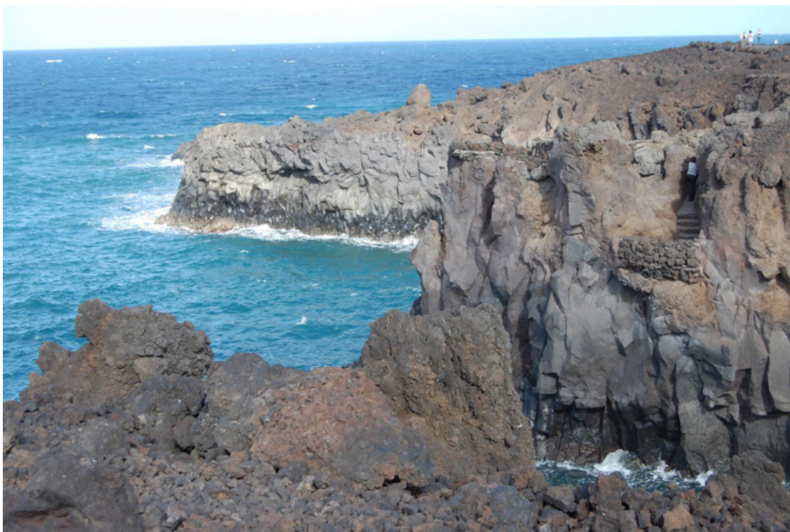
Море и скалы – это Канары

В этой книге будет очень много дат и имен. События Средневековья переплетутся с поисками ученых дня сегодняшнего. Сведения первых хронистов, единственных очевидцев, способных складно изложить творившееся на островах, будут подкреплены последними археологическими, лингвистическими и антропологическими открытиями.