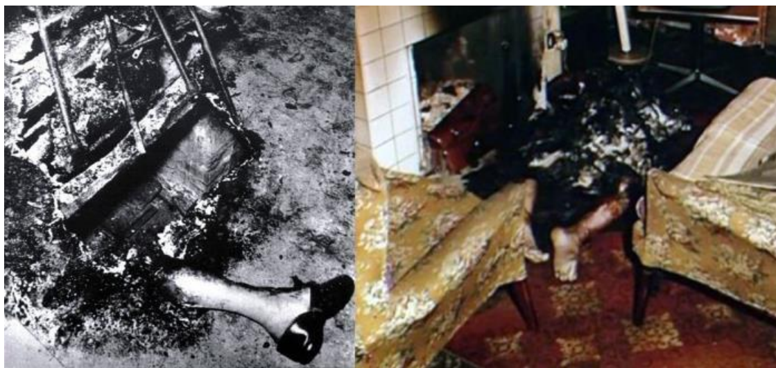
Спонтанное самовозгорание человека