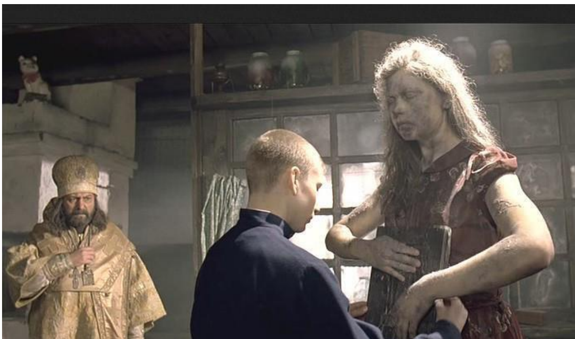
Великое стояние Зои. (Кадр из фильма)

Жутко было сторожам, и они стали уговаривать Зою: «Что ты так ужасно кричишь?» Но Зоя продолжала кричать: «Страшно, страшно, земля в беззаконии горит. Молитесь. Люди в грехах гибнут. Молитесь!»