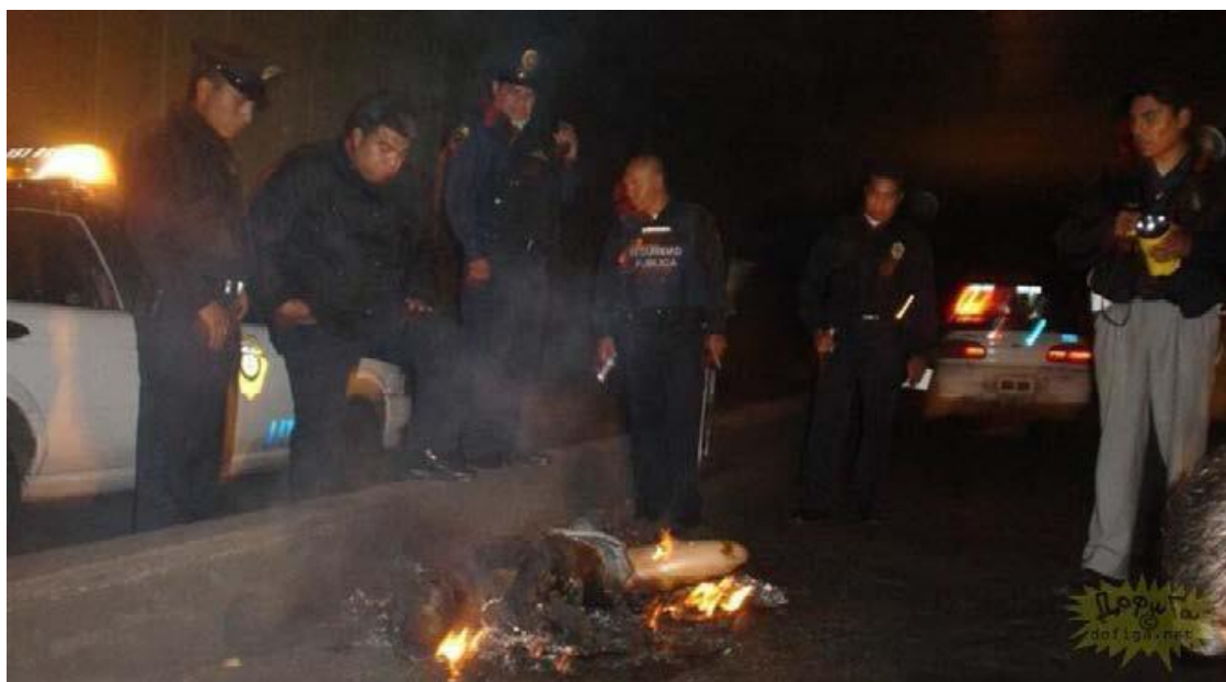
Пример самопроизвольного возгорания человека