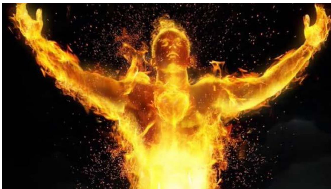
Живущие в пламени

Распространенное мнение о казни слуг Сатаны только путем сожжения на костре («аутодафе» – «дело веры») является в корне неправильным. Видимо, слишком часто «колдуны» оказывались саламандрами, вызывая ужас и простолюдинов, и самих инквизиторов. Возникали такие толкования чудесного спасения от огня, как «коррекция несправедного приговора волею Господа», а сам спасшийся колдун – «осененным Божией благодатью».