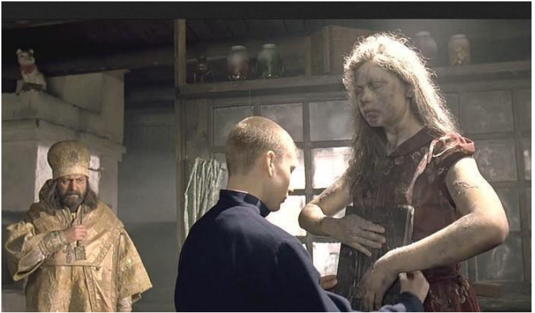
Великое стояние Зои. (Кадр из фильма)

Жутко было сторожам, и они стали уговаривать Зою: «Что ты так ужасно кричишь?» Но Зоя продолжала кричать. «Страшно, страшно, земля в беззаконии горит. Молитесь. Люди в грехах гибнут. Молитесь!»