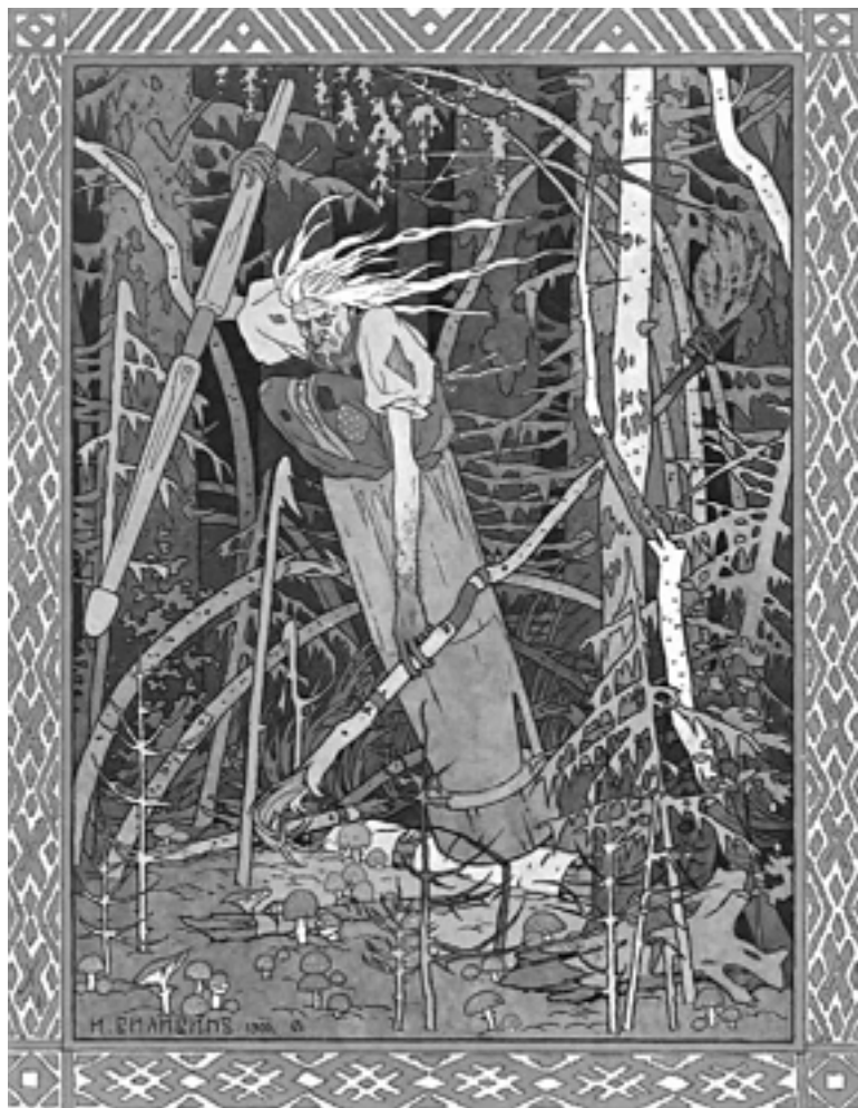
И.Я. Билибин. Баба-яга