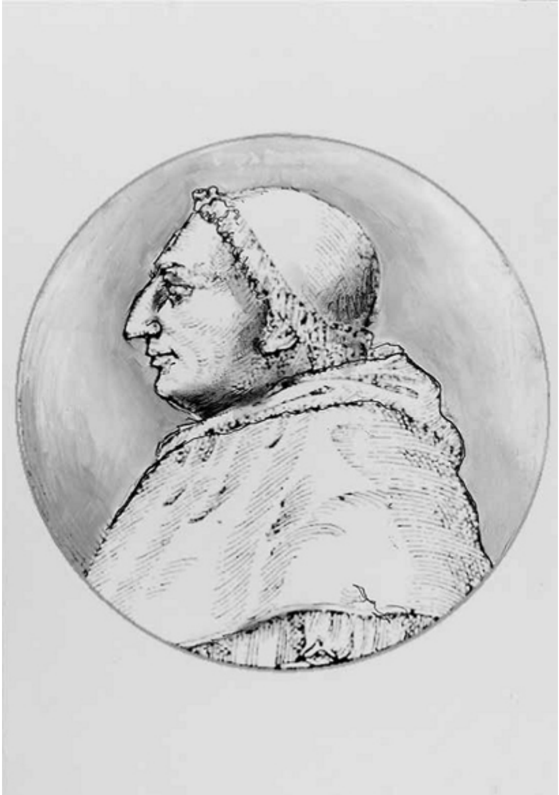
Папа Иннокентий VIII