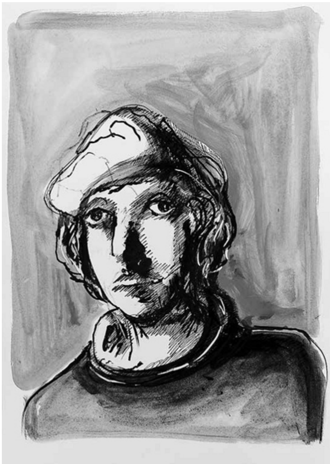
Родриго Борджиа (папа Александр VI)