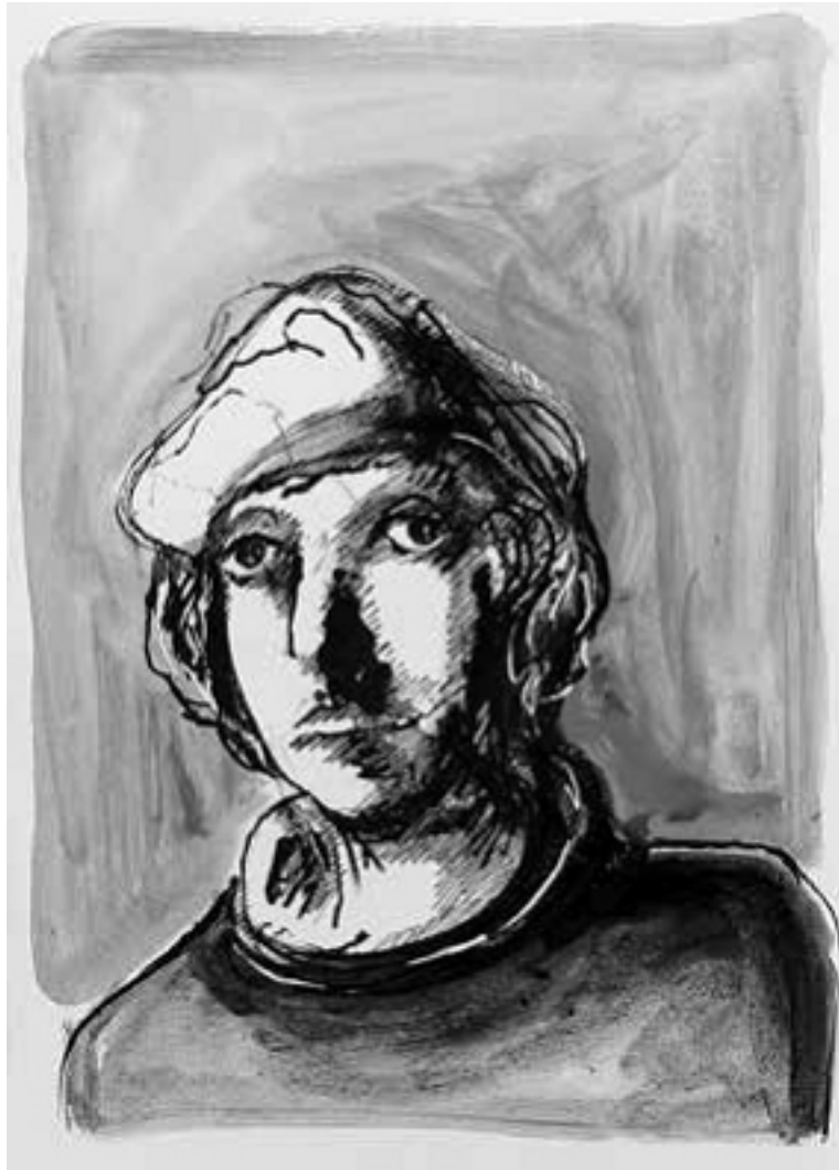
Чезаре Борджиа, Валентин

«Спора нет, Чезаре действительно любил Лукрецию, любил как брат. Может быть, даже больше – как десять тысяч братьев. Но... Она была для него единственным исключением из всех женщин, которых он не то чтобы ставил ни во что (что хотел, он от них брал), но за полноценных людей не считал. Чезаре и Лукреция сохраняли верность друг другу до конца жизни» 13 .