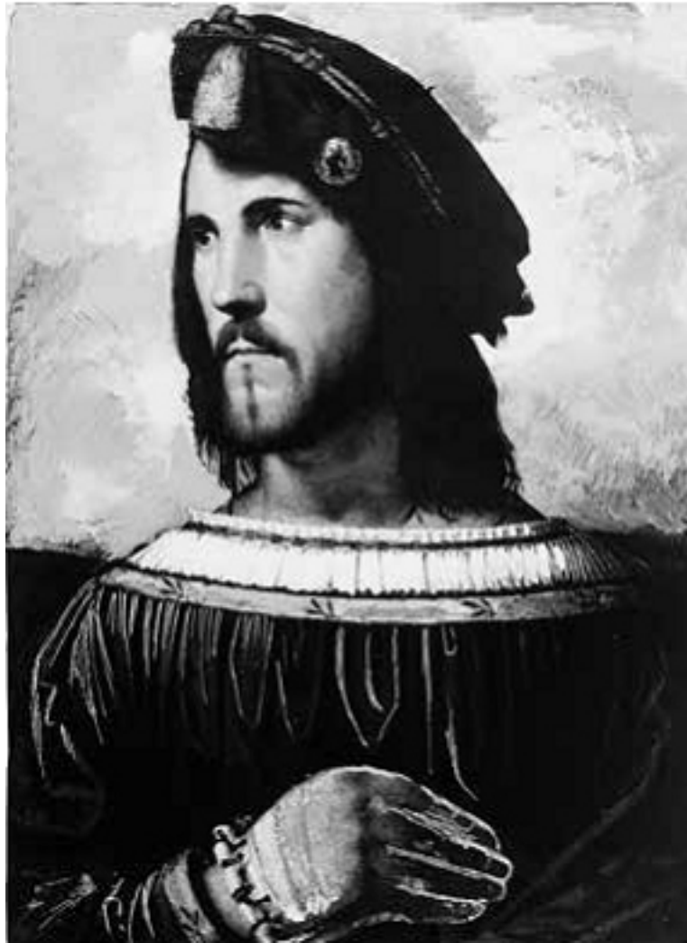
Чезаре Борджиа, «ужасный сын»

Теперь из Марке перенесемся в деревушку близ Феррары. На берегу реки стоит старинный монастырь. Когда-то его забросили из-за чумы, бушевавшей в окрестностях, а несколько месяцев назад обитель начали обживать заново.