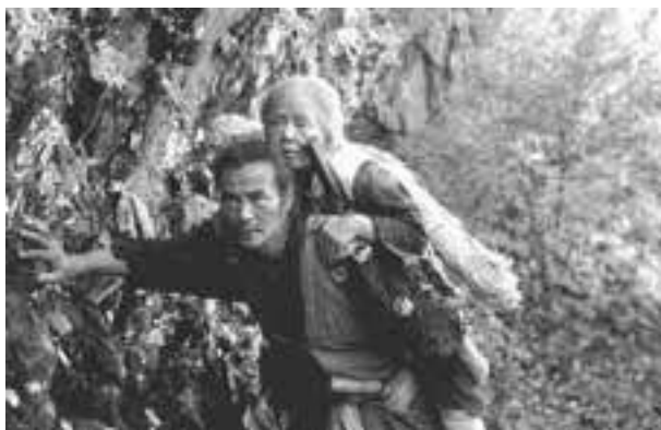
Кадр из кинофильма «Легенда о Нараяме» (Япония, 1983)

В японском фильме «Легенда о Нараяме» (1983), который исполнен грубого, иногда шокирующего натурализма, повествуется о том, что жизнь всегда сопровождается смертью, а любовь к близким часто требует самопожертвования. Действие происходит в XIX столетии в японской деревушке, пораженной голодом. Чтобы не умирать голодной смертью, жители ввели ритуал умерщвления бесполезных членов сообщества: новорожденных мальчиков просто убивали, а пожилых людей их собственные дети относили на вершину горы Нараяма и оставляли умирать. Орин, женщина 69 лет, должна умереть. Ее сын не хочет выполнить ритуал, но того требует мать, верная традиции. Найдя жен своим детям, она начинает последний подъем на вершину, привязанной к спине сына.