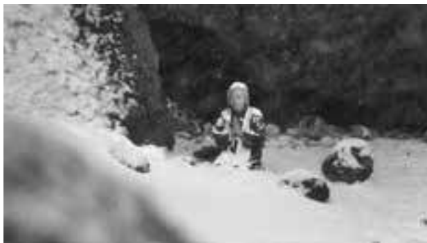
Кадр из кинофильма «Легенда о Нараяме» (Япония, 1983)

«Существуют еще народы, которые разрешают вопрос о старости самым простым образом: они убивают своих стариков, – писал выдающийся российский физиолог, лауреат Нобелевской премии в области медицины и физиологии (1908) И. И. Мечников в своей вышедшей в 1907 г. книге «Этюды оптимизма». – В цивилизованных странах вопрос этот осложняется вмешательством возвышенных чувств и соображениями общего характера. По всей Меланезии распространен обычай закапывать живыми стариков, бесполезных для работы. На Огненной Земле, когда угрожает голод, старух убивают и поедают раньше, чем приняться за собак. Туземцы объясняют это тем, что собаки ловят моржей, между тем как старухи не могут делать и этого. У некоторых индейцев Северной Америки по крайней мере половина стариков бросается на произвол судьбы в том случае, когда они не могут ходить. Считается это в порядке вещей и оправдывается тем, что лучше умереть, чем влачить бесполезное, полное страданий, старческое существование. В средневековой Японии действительно существовал обычай под названием “убасуте” – что-то вроде прижизненных похорон для стариков, которых впоследствии оставляли умирать в горах» [230, с. 1].