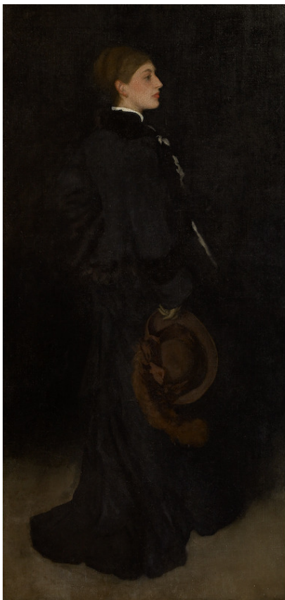
Дж. Уистлер. Портрет Мисс Кордер

Между диванами – непременно, модные в тот год, пальмы в кадках. Под потолком слегка пародийная стилизация люстры, изображенной на картине Адольфа Менцеля «Кон-