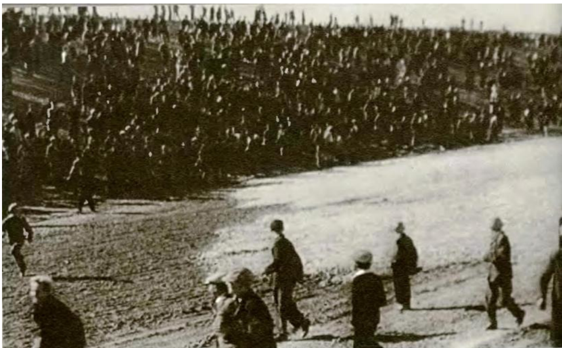
Днепровская вода в Крыму. 18.10.1963.

18 октября 1963 г. Британия: ушел в отставку премьер Гарольд Макмиллан