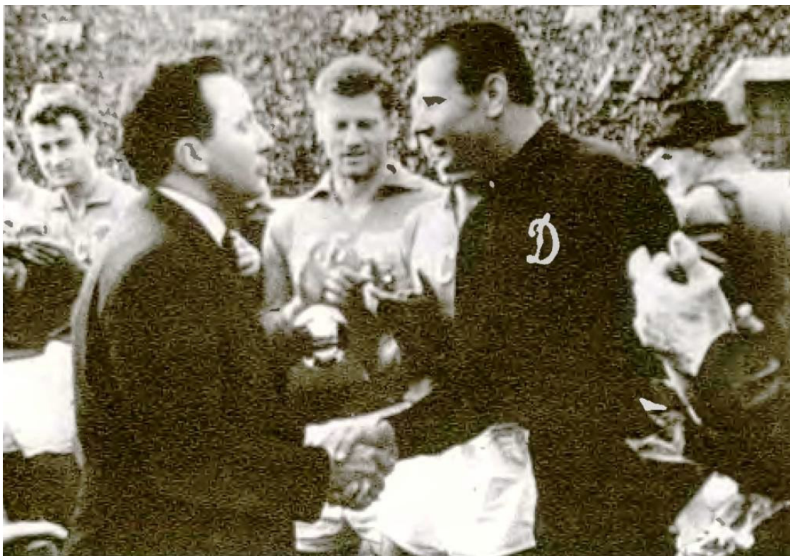
Лев Яшин получает в 1963 г. «Золотой мяч».

17 июня 1964 г. спорт: родился Михаэль Гросс – немецкий пловец, чемпион