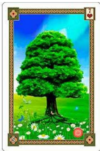
Карта Дерево из колоды «Оракул Ленорман»

Что касается движения, то карта Дерево в этом очень похожа на карту Дом, но с небольшим отличием. В данной карте движение всё-таки присутствует. Более того, это движение направлено вверх, а также в сторону расширения и развития. Правда продвижение это крайне медленное и незаметное. Возможно предположить, что заметный прогресс будет наблюдаться или периодически обретать активность всего лишь один раз в год.