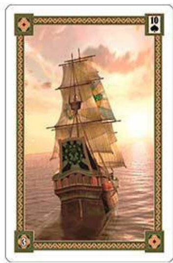
Карта Корабль из колоды «Оракул Ленорман»

Характер движения по этой карте медленный, но само движение имеет чётко заданный курс. В отличие от карты Всадник, где направление и скорость процесса может изменить сам человек, по карте Корабль свобода действий у него довольно ограниченная.