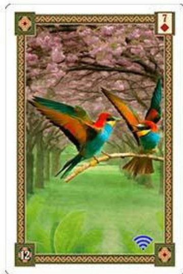
Карта Птицы из колоды «Оракул Ленорман»

С первого взгляда может показаться что данная карта статична, однако это не совсем так. Птицы на карте хоть и сидят на ветке, они там общаются, передают друг другу информацию, а значит происходит движение и обмен энергии. Хотя, строго говоря, сама информация энергией не является и вопрос активности в этой карте больше касается именно способа или метода передачи этой информации. Поэтому можно сказать, что карта символизирует некую активность, связанную с прохождением и обработкой информации .