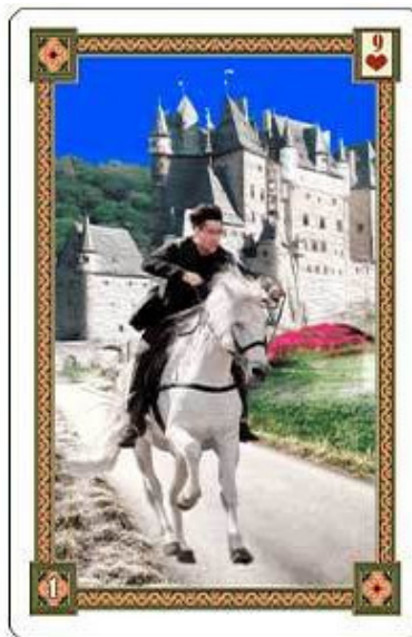
Карта Всадник из колоды «Оракул Ленорман»

Эта карта наиболее ярко выражает идею движения, активности и предприимчивости. Она обозначает быстрое протекание процесса, а также прямоту и целенаправленность действий. Активность может быть любая: физическая, психическая или духовная. Важно отметить, что в карте Всадник особенностью этой активности является её управляемость и контролируемость. Так как наездник на рисунке карты крепко держит поводья в своих руках, напрашивается вывод, что решение к действию в той или иной ситуации принимает сам человек, и это он задаёт нужную ему скорость и направление.