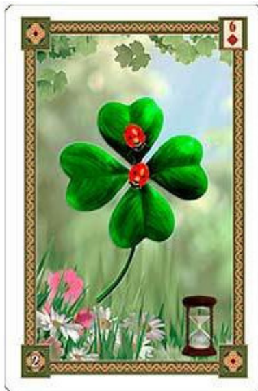
Карта Клевер из колоды «Оракул Ленорман»

Сама по себе карта Клевер не является картой движения. Тем не менее, в этом смысле она имеет одну особенность. На рисунке карты из представленной здесь колоды, в её правом нижнем углу изображены песочные часы. Этот инструмент символизирует понятие скоротечности и мимолётности. Например, если слева от Клевера, будет лежать карта Всадник или другая динамичная карта, то можно сказать, что прежняя динамика и скорость развития событий, со временем начнёт ослабевать и замедляться. Это конечно не полная остановка как в карте Гора или как в карте Гроб. В карте Клевер эффект замедления очень плавный и постепенный, но в то же время достаточно заметный и осязаемый. Здесь можно провести аналогию с автомобилем, когда в его баке заканчивается топливо и ехать с той же самой скоростью осталось уже недолго, но он всё ещё на ходу. Движение присутствует, но происходит это уже скорее по инерции и постепенно будет всё больше замедляться.