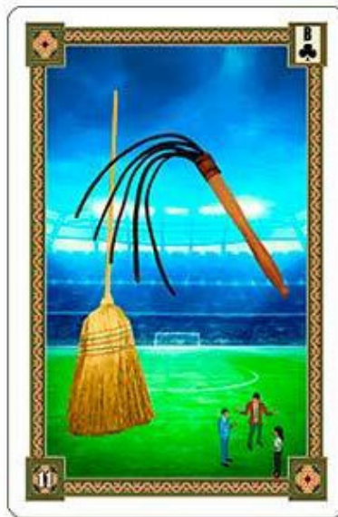
Карта Плеть из колоды «Оракул Ленорман»

Карта Плеть символизирует в основном повторяющиеся механические и физические движения или воздействия. А также повторяющийся один и тот же разговор. Как правило, источником такой активности служит словесный спор, конфликт, разбирательство, процесс добычи или предоставления какой-нибудь информации.