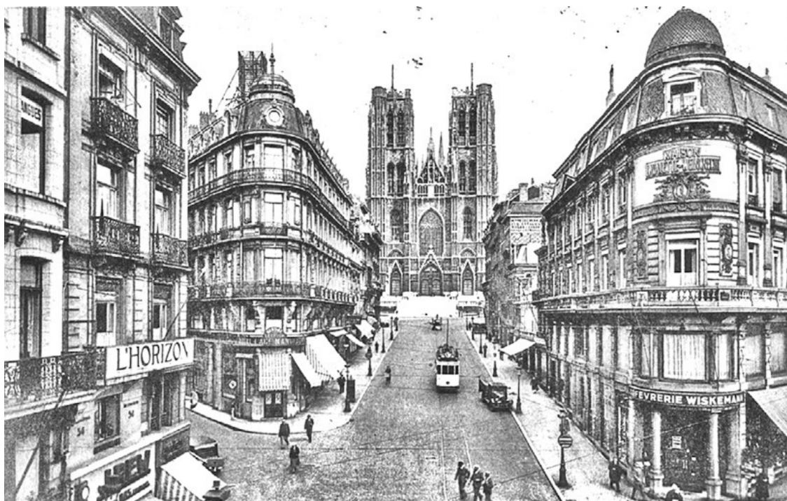
Брюссель. Начало XX века

Сегодня «западный вопрос» по-прежнему актуален и снова вызывает яростные споры в нашем обществе. А потому вспомнить, что писали не самые глупые наши люди сто лет назад, более, чем полезно. И нельзя не отметить, что если из некоторых статей убрать имя автора и год публикации, можно подумать, что написаны они совсем недавно – настолько точно и злободневно звучат многие их пассажи и фразы.