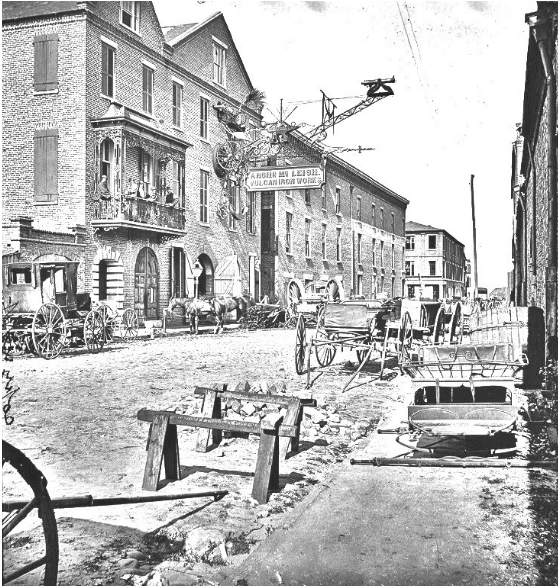
Чарлстон, Южная Каролина, США, 1865 год

Негры не составляют настоящего повода к войне. Если б дело шло об одних неграх, то с эмансипацией их дело должно бы и кончиться. Эмансипация их неизбежна для Южных штатов; но если бы и совершилась эта эмансипация, то Северные штаты точно также не допустили бы разрыва. Известно, что некоторые штаты, в которых нет невольничества, хотели было отложиться, но федералистская армия заставила их обратиться в Союз. Дело, стало быть, в сохранении самой политической организации. Но если даже Южные штаты и покорятся, то это будет уже не прежняя, а новая политическая организация с принципом насилия и принуждения, организация союза, вскормленная, так сказать, междоусобным раздором, крещенная в братней крови!