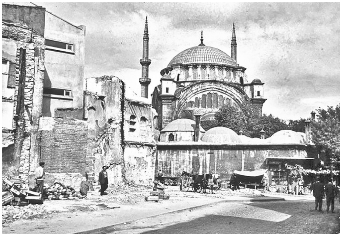
Улица Стамбула и мечеть Нуросмание, Турция, 1890-1900 годы

Как только, благодаря совершенству путей сообщения, мир Дальнего Востока тесно соприкоснулся с миром американо-европейским, стало несомненно, что мирное сожительство их невозможно. Между ними мыслимо лишь одно отношение: открытая война или скрытое соперничество. В открытой войне первоначально имели успех европейцы, которые в течение долгих столетий чуть не все силы своего ума устремляли на изобретение орудий разрушения и истребления и в искусстве военном достигли большого совершенства. Но в экономическом соперничестве с самого начала верх оставался за желтолицыми. Америка и Австралия должны были начать длящуюся до сих пор борьбу с нашествием китайских рабочих и японских промышленников. Японские изделия стали вновь отбивать только что занятые европейцами рынки. Наконец, война японо-китайская и русско-японская показали, что и в военном деле Дальний Восток быстро сравнялся с Европой. Теперь эти два мира стоят друг перед другом, и лишь второстепенные причины не дают воочию узнать, что наша последняя война была первой Пунической 33 , первой войной нового Востока со старым Западом.