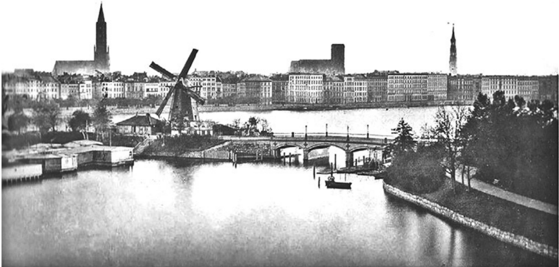
Гамбург около 1860 года, Ломбардский мост

Деспотизм – это варварство, погребение дряхлой цивилизации, а иногда ясли, в которых рождается спаситель.