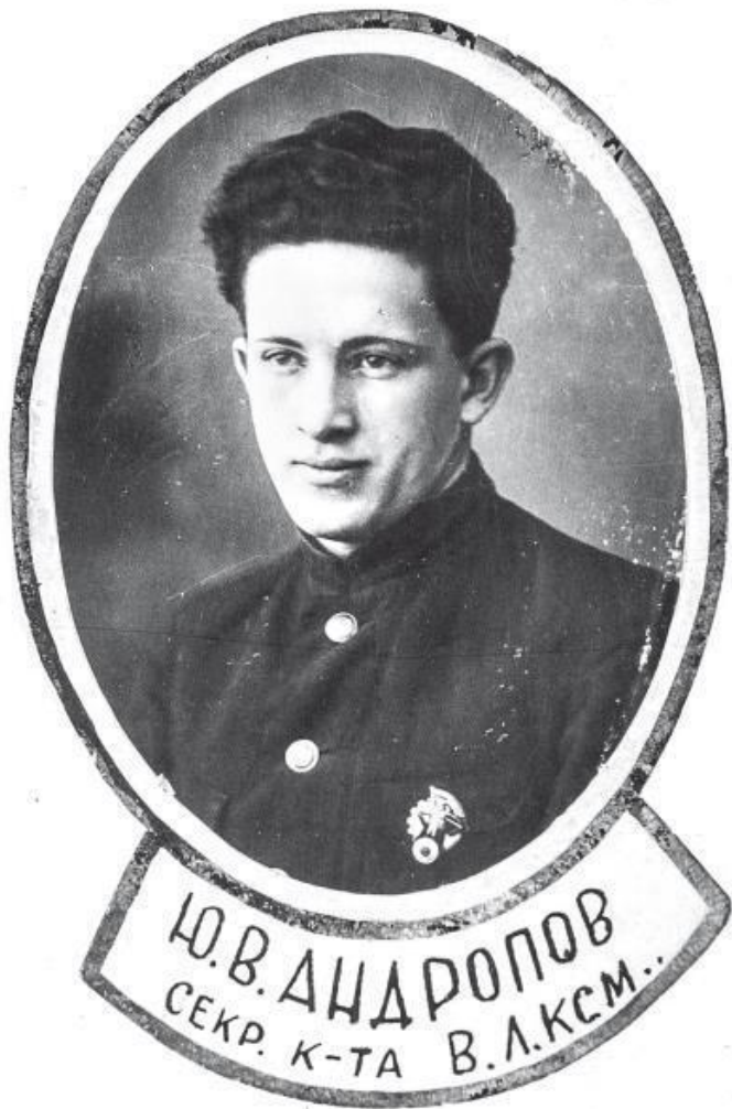
Ю. В. АНДРОПОВ СЕКР. К-ТА В. Л. КСМ..