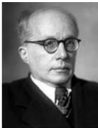
С.Л. Рубинштейн (1889-1960)

Выдающийся советский психолог и философ. Создатель деятельностного подхода в психологии. Сформулировал принцип единства сознания и деятельности.