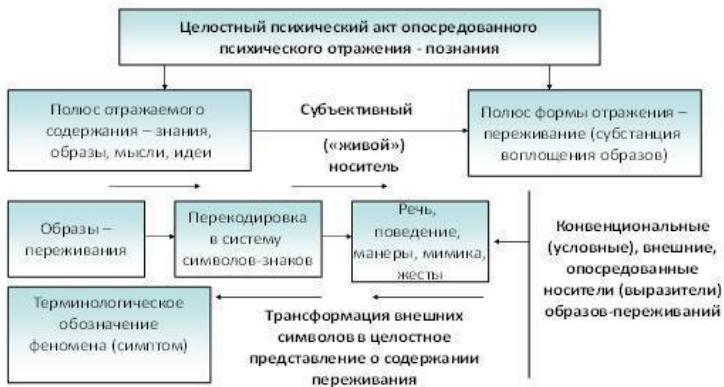
Рис. 6. Схема опосредованного отражения психического как объективной реальности

Деятельность как объективный индикатор всех психических явлений.