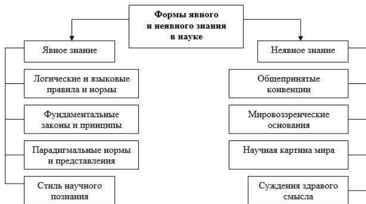
Рис. 1. Формы явного и неявного знания в науке

Рациональность – обоснованность, доказательность.