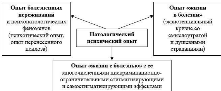
Рис. 7. Субъективная психическая реальность, внутренний мир

душевнобольного человека (разновидности психического опыта)