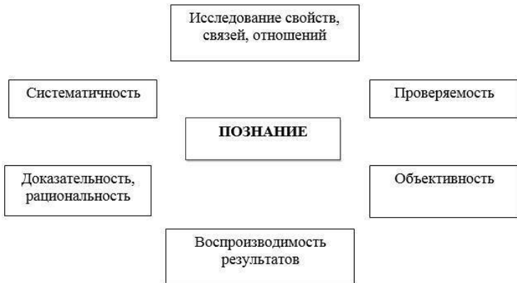
Рис. 3. Виды научного познания

В медицине также используются два вида диагностического познания: