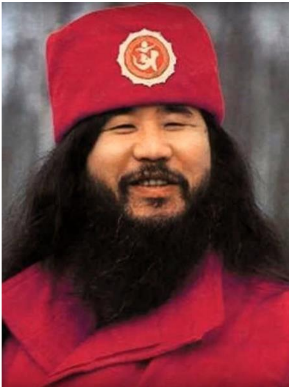
Редакторский проект Марата Нигматулина