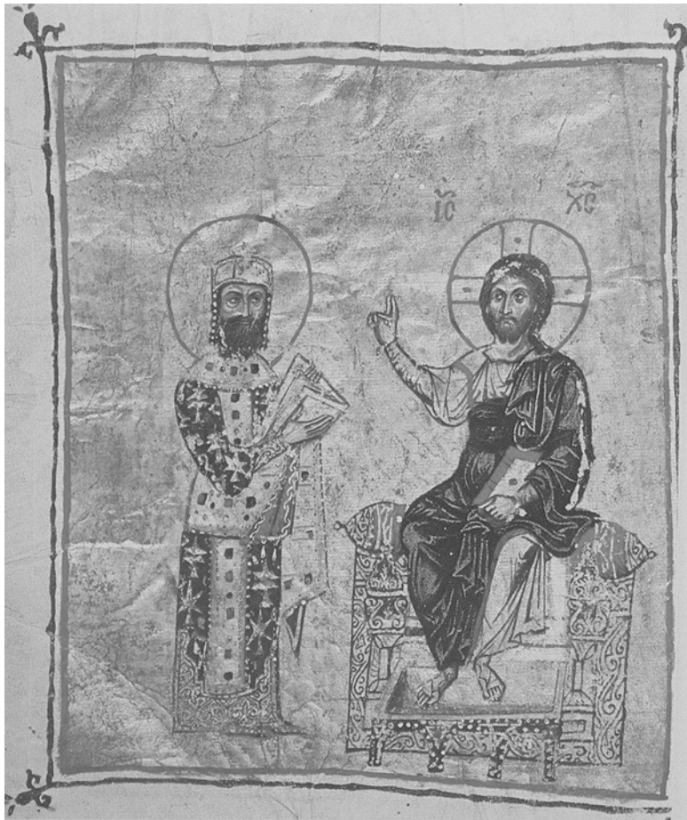
Христос благословляет императора Алексея I Комнина. Миниатюра рукописи из собрания Афинского колледжа, XIII–XIV вв.