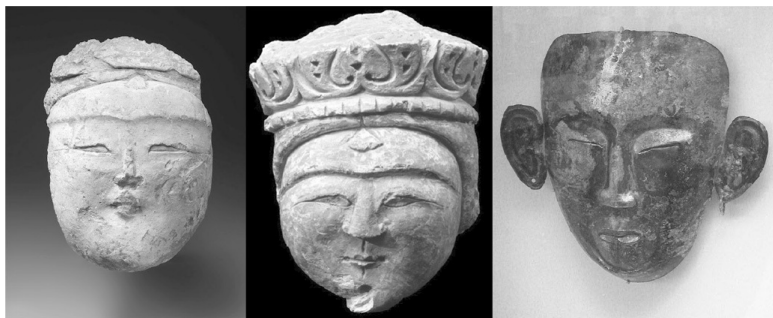
Сельджукские воины XI–XII вв. Киданьская погребальная маска X–XII вв.

ные отношения с хазарскими каганами, брать в жены тюркских княжон, а основную массу сельджукских вооруженных сил, в любом случае, составляли тюркские племена огузов. Завоевание сельджуками Анатолии после 1071 года создало предпосылки для ассимиляции тюрками греческого населения этого региона, а новые потоки туркменских племен, мигрировавших по маршрутам, которые были проложены сельджуками в XI веке, в итоге привели к появлению в конце XIII века Османского государства.