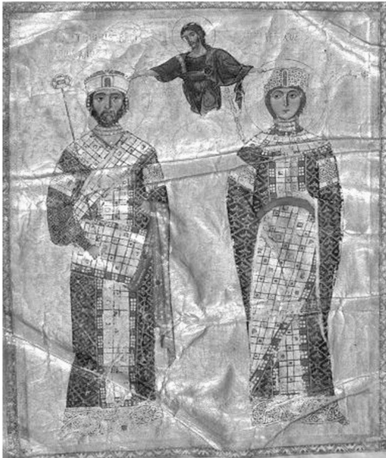
Императрица Мария Аланская. Деталь миниатюры из византийской рукописи из собрания Французской Национальной Библиотеки, BNF Coislin 79, f o 2 bis v o