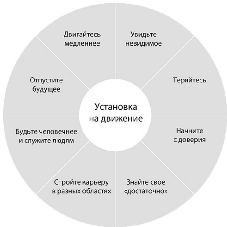
Рис. 1. Установка на движение и суперспособности

Возможно, вы уже заметили тут необычную уловку: суперспособности к постоянному движению становятся такими только в случае, если вы приняли установку на движение и верите, что наилучший путь вперед – это создание нового сценария. Если вы застряли в старом, привычном сце-