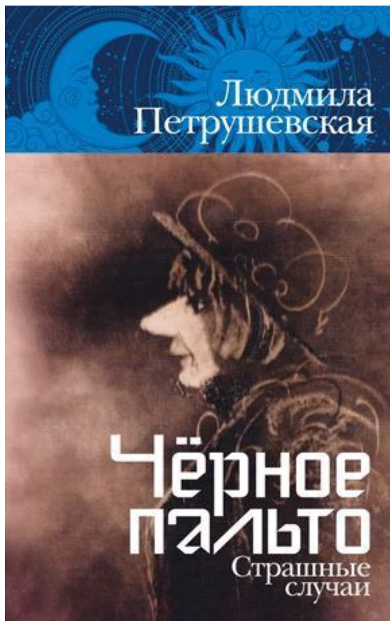
Чёрное пальто: Страшные случаи Людмила Петрушевская