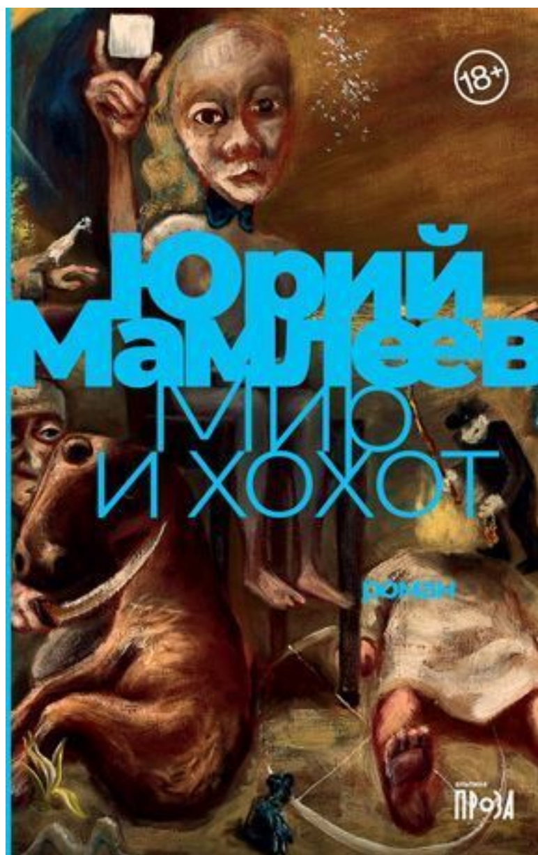
Мир и хохот Юрий Мамлеев