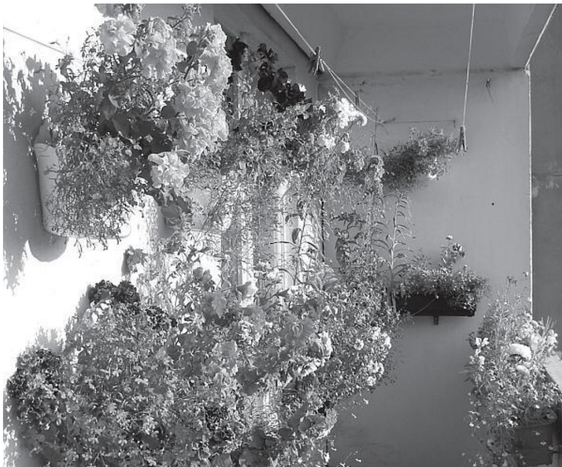
Фото 3. Балкон в июле (ящики № 1–7 и пять навесных кашпо)