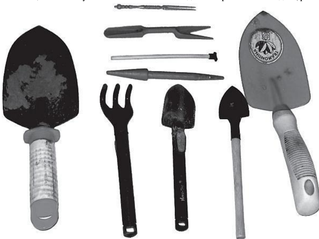
Фото 1. Инструменты для посева, пикирования и высадки цветов

Кроме того, могут понадобиться инструменты для посева и пикирования : ножницы, специальная палочка для посадки семян (можно заменить карандашом или старой шариковой ручкой, маленькие грабли, зубочистка, спичка или вилочка для бутербродов для передвижения мелких семян, маленькая узкая лопаточка с выемкой для пикирования и посадки (фото 1).