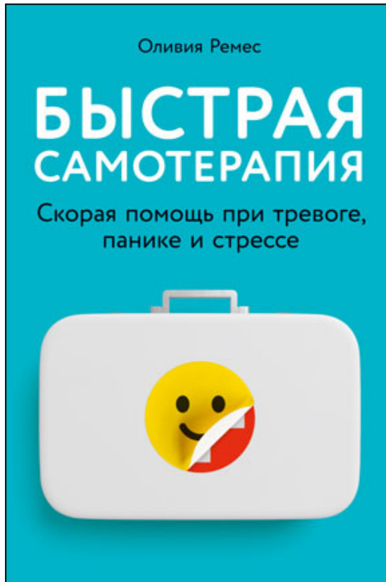
Быстрая самопомощь при тревоге, панике и стрессе Оливия Ремес