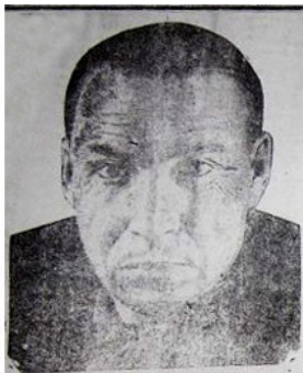
НИКОЛА ДМИТРИЕВИЧ КАБАКОВ в Горах Кабаковских — на фоне традиционных уральских пейзажей — тогда же, как и теперь. Справа — его собственное изображение в Горах Кабаковских в 1929 году. Кабаков много лет жил в Горах Кабаковских, славясь среди их жителей и в Свердловской области.

дился одним из важнейших государственных функционеров на просторах этого богатейшего региона. А после того, как в 1929 г. стал руководителем парторганизации, Кабаков превратился, без преувеличения, в безраздельного хозяина. То есть существовало, конечно, где-то там, далеко в Кремле фантастическое Политбюро и не менее фантастические органы власти вроде Совета Народных Комиссаров и Всесоюзного Центрального Исполнительного Комитета, но здесь, на земле, в горах, лесах Предуралья, Урала и Зауралья, власть олицетворял персонально товарищ Кабаков. Неслучайно производное от его фамилии понятие «кабаковщина» на долгие десятилетия превратилось для жителей уральского региона в синоним беспредела, произвола и самодовольного барства.