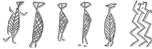
Рис. 4. Фигурки, вырезанные на кости из Рюемаркгорда, о. Зеландия, Дания. Высота – около 2,6 см. Хранятся в Национальном музее Копенгагена

людей с капюшонами, а на обрыве в Рёдее был найден рисунок, на котором изображен мужчина в рогатом головном уборе, стоящий на лыжах. Это вполне могло быть изображение шамана, отправившегося в сверхъестественное путешествие.