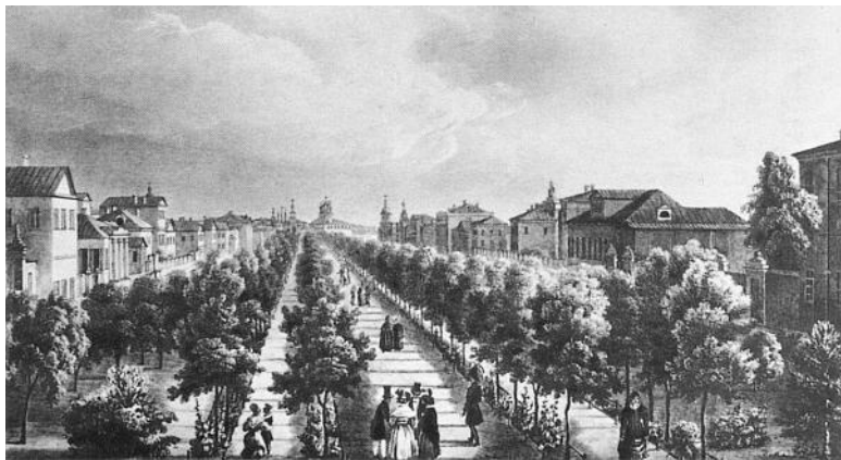
Тверской бульвар в 1825 г.