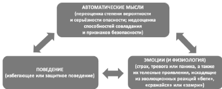
Рис. 1. Треугольник тревоги

ет тревогу и изначальные мысли об опасности, поскольку в этом случае человек не получает опыта безопасности столкновения с пугающим стимулом (рис. 1).