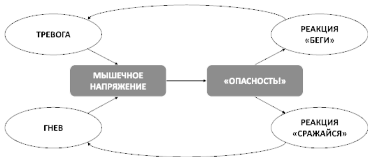
Рис. 8. Порочный круг мышечного напряжения

Этот порочный круг возникает потому, что психика и тело неразрывно связаны между собой, о чем еще в XVII веке так или иначе говорил французский философ Р. Декарт, заявляя о так называемой психофизической проблеме. Поэтому где избыточные эмоции – там телесное напряжение, а где телесное напряжение – там избыточные эмоции.