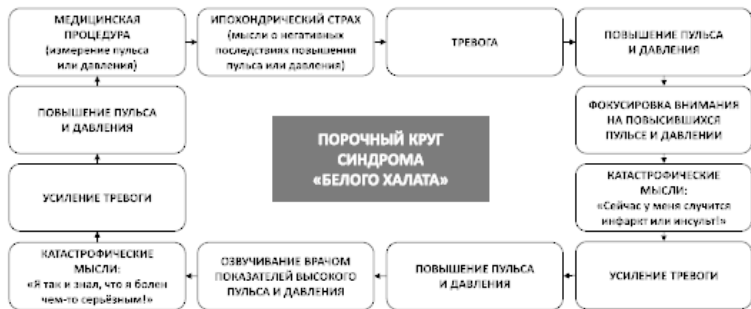
Рис. 12. Порочный круг синдрома «белого халата»