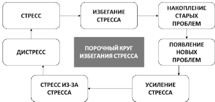
Рис. 2. Порочный круг избегания стресса

По причине накопления старых и возникновения новых проблем человек испытывает более сильный стресс, мешающий эффективно справляться как с проблемами, так и с самим стрессом. В конечном итоге человек может испытывать стресс из-за самого стресса, что как раз и ведет к вышеописанному дистрессу (рис. 2). Однако формирование нового, более рационального и реалистичного мышления и устранение неадаптивных моделей поведения способствует не только эффективному решению проблем, развитию стрессоустойчивости и саморазвитию, но и профилактике различных эмоциональных расстройств и дистресса.