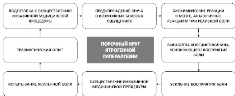
Рис. 11. Порочный круг ятрогенной гипералгезии

шение чувствительности к боли), суть которого раскрывается в нижеприведенной схеме (рис. 11).