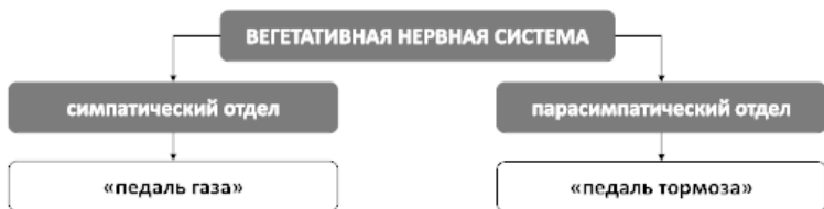
Рис. 4. Устройство вегетативной нервной системы

Если симпатический отдел отвечает за мобилизацию организма при реальной или даже представляемой в мыслях