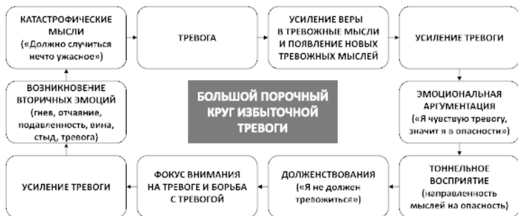
Рис. 7. Большой порочный круг избыточной тревоги

ние на тревоге и усиливая ее, что ведет к бессмысленной и беспощадной борьбе с тревогой, а также к возникновению вторичных эмоций по поводу тревоги – гнева, отчаяния, подавленности, вины, стыда и прочих (рис. 7).