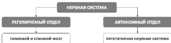
Рис. 3. Устройство нервной системы

Автономный отдел нервной системы называется вегетативной нервной системой, которая, в свою очередь, подразделяется на симпатический и парасимпатический отделы.