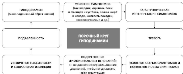
Рис. 9. Порочный круг гиподинамии