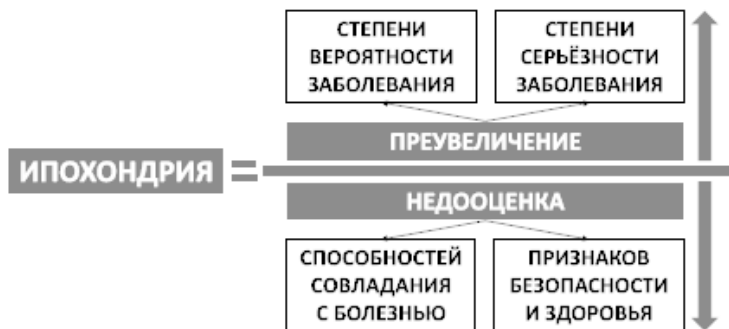
Рис. 13. Формула ипохондрии

Как и любая другая, тревога, вызванная ипохондрическими переживаниями, образуется вследствие преувеличения степени вероятности и серьезности негативных сценариев развития событий (в данном случае болезней), а также в результате недооценки внешних и внутренних ресурсов (способностей совладания с болезнью) и реальных признаков безопасности (в том числе признаков здоровья) (рис. 13).