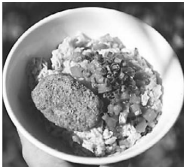
Рис. 1.3. Зерновые котлеты без мяса

Но я предупреждаю: будьте готовы к тому, что по вкусу эти котлеты ничем не отличаются от обычных мясных!