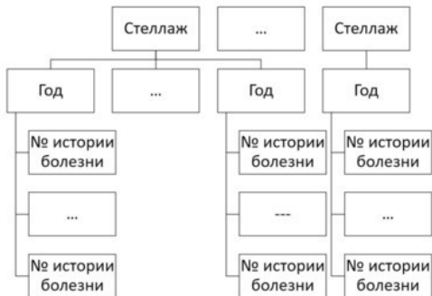
Рисунок 4. Хронологически-структурная схема хранения истории болезней