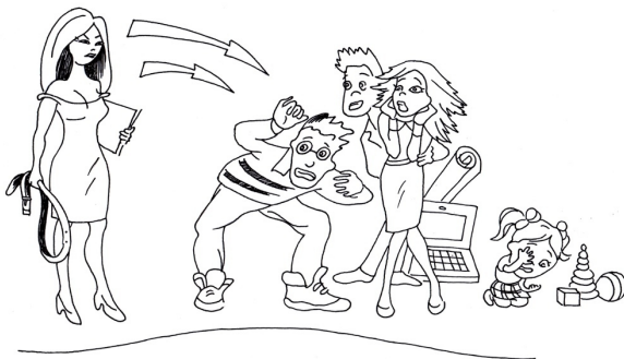
Рисунок 2. Максимальный контроль

В этом контексте я не опишу вопрос лучше, чем это сделал американский психолог Эрик Берн в книге «Игры, в которые играют люди». Она была опубликована еще в 1964 году, но не теряет актуальности и продолжает быть моей настольной книгой. Она непростая к восприятию, но рекомендую ее к прочтению всем женщинам, которые хотят разобраться со своей ролью в этом мире. Удивительно, как в каждой паре/ситуации можно увидеть проявление конкретных