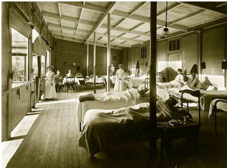
В стенах лечебного пансионата

реться психологам и психиатрам. Что, без сомнения, стало бы ключиком к шкафу с пресловутыми скелетами. «Восемнадцатилетняя Гала – нелюдимая, холодная, суровая, раздражительная, одинокая. Девушка до такой степени замкнута, что это наводит на мысль: не скрывает ли она что-нибудь? Есть ли ей о чем умалчивать? Тайна происхождения? Болезненные воспоминания? А может, она предпочитает навсегда отделаться от своего прошлого, чтобы не оживлять, думая о нем беспрестанно, неизбежное страдание. Елена ничего не говорит о своем прошлом, о своей биографии. Любой вопрос о предыдущей жизни выводит ее из себя».