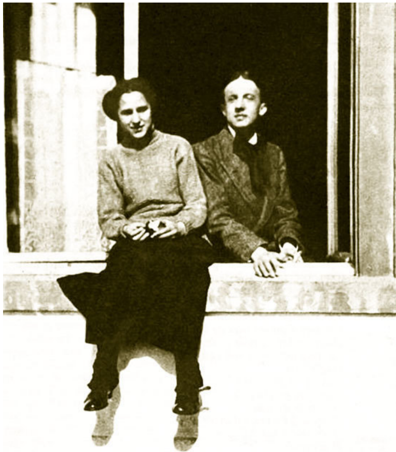
Гала и Поль Элюар в Клаваделе. 1913 г.

Одно время, довольно продолжительное (если не наве-