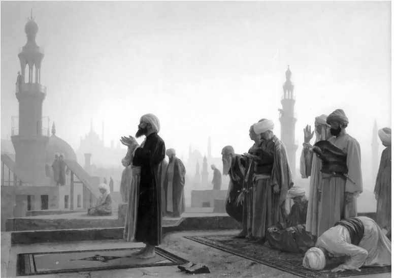
Молитва. Художник Жан-Леон Жером

порядок в той смеси хаоса и случайностей, из которых и состоит, в сущности, жизнь, если на нее взглянуть глазом непредвзятым и немужским.