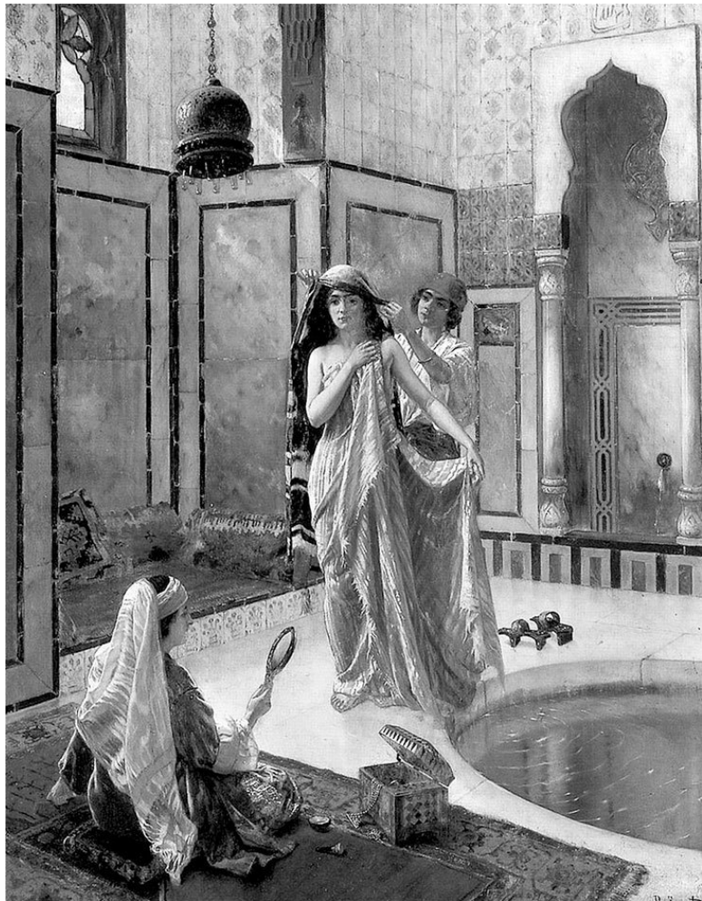
Бассейн гарема. Художник Рудольф Эрнст