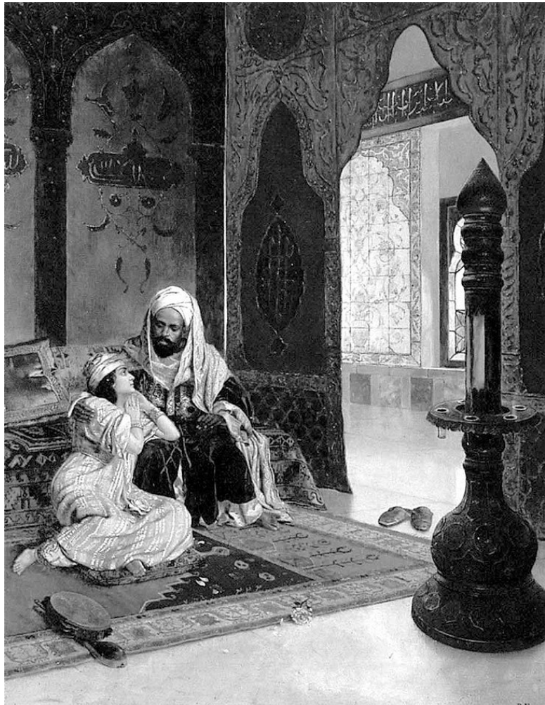
Фаворитка. Художник Рудольф Эрнст