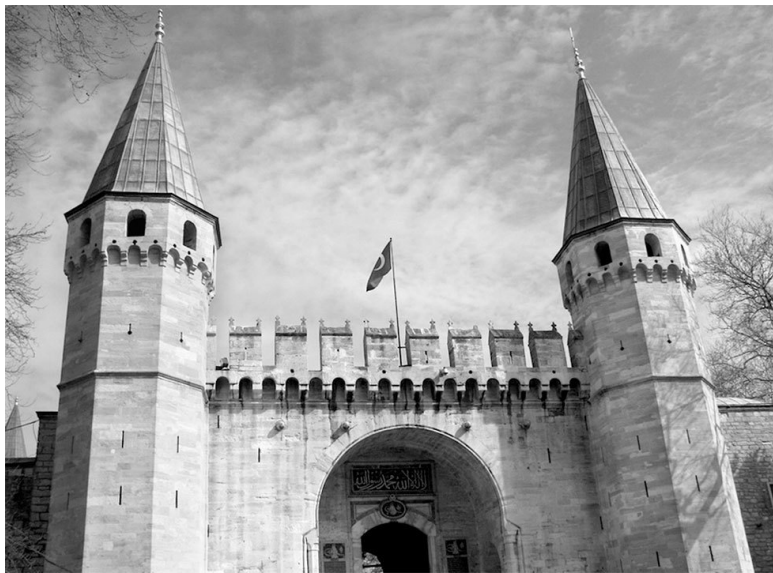
Главные ворота дворца Топкапы

перь обречен был жить как сова. И когда выпадало ему провести ночь с женщиной, то вымучивал ее, не давая уснуть ни на минутку, жестоко и неумолимо подгонял ее в утехах и ласках: «Не сплю я, так и ты не смеешь спать».