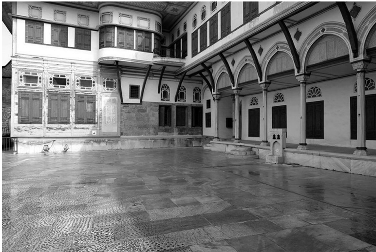
Двор гарема дворца Топкапы