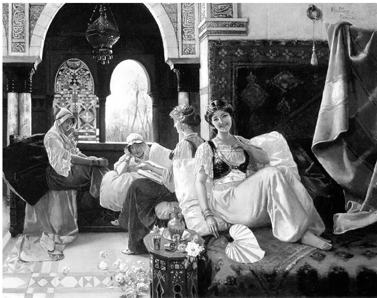
Будни гарема. Художник Кинтана Блас Оллерас

Вслепую она ткнулась в брег ложа, обеими руками держала тяжелую чашу, пила, проливая себе на ноги, на ковер, почувствовала на своем нетронutom, пугливом теле сухую, теплую руку, была не в силах сопротивляться той руке, которая опрокинула ее на край ложа, и султан тоже почувствовал пугливость ее тела и тоже не мог (или не хотел) сдерживать свою страсть, не мог ждать, «когда упадет падающее...».