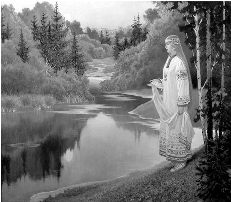
Купава. Художник Б.М. Олшанский

Девчушка не закована в железо, не прикована ни к кад- риге, ни к несчастным своим подругам, не светит она на- гим телом, а укутана заботливо в шелка, чтобы тело ее не утратило нежности; жилистый евнух-суданец, посвященный