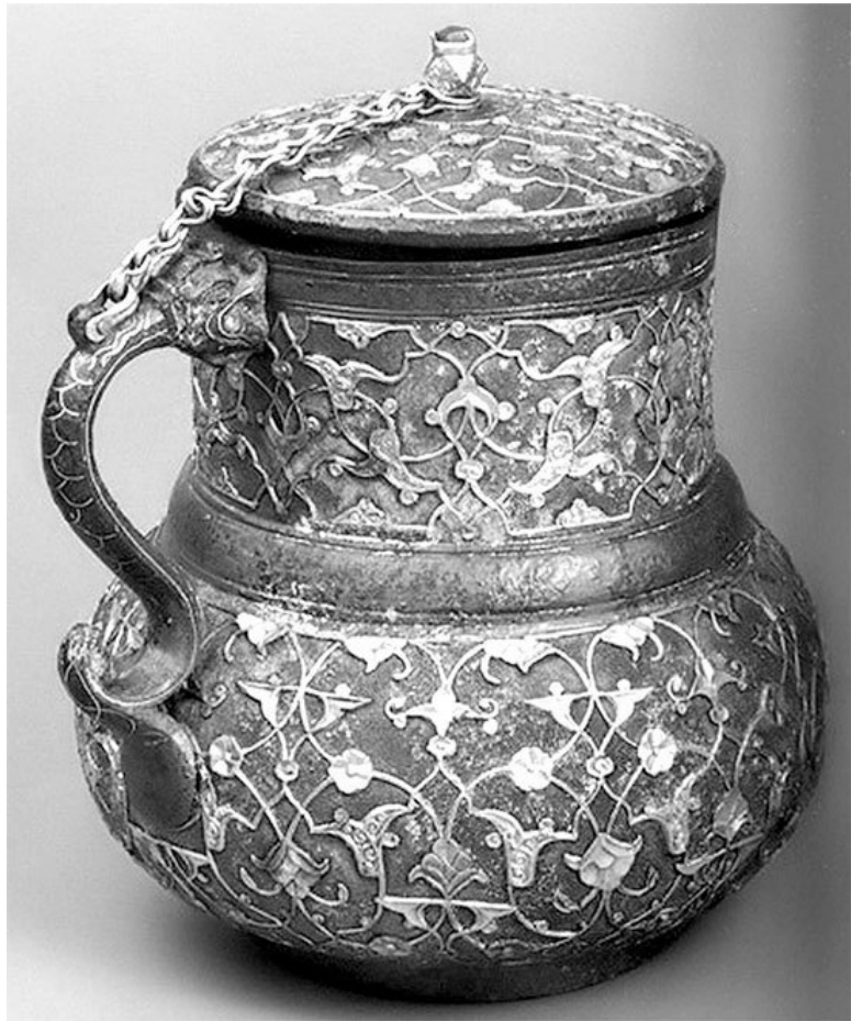
Кружка. Османская империя, XVI век

И внезапно увидел эту колонну. Он остановился и долго