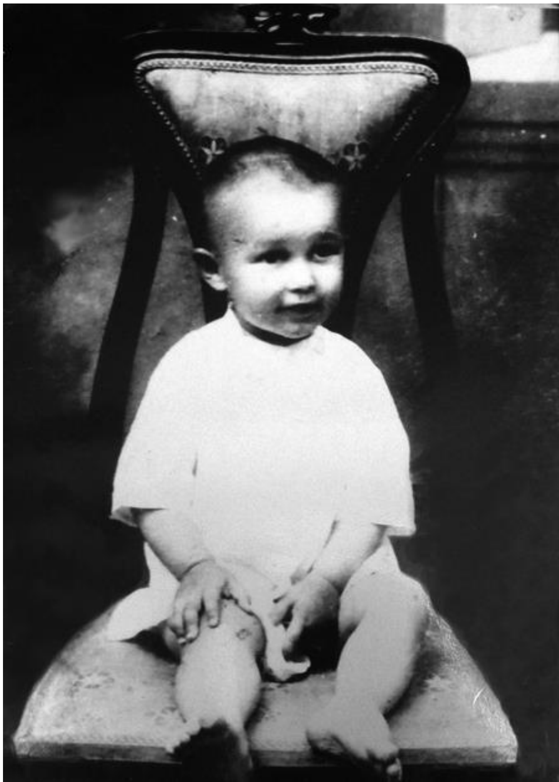
Замятин в раннем детстве (середина 1880-х годов)

Сохранилось несколько длинных и очень ласковых писем к «милрой маме», написанных еще до того, как он научился отделять слова друг от друга. В одном, написанном в конце 1880-х или начале 1890-х годов, он сообщает, что у его сестры Саши (Александры) болят гланды, что коза «стала брухаться», что астры в банке начали распускаться, и что он ест постное (яйца)