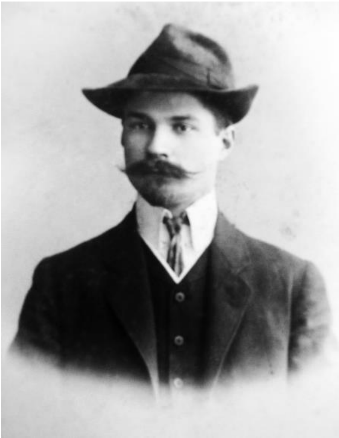
Замятин в Санкт-Петербурге (приблизительно 1910 год)

вал создание парламента – Думы, избираемой узко ограниченным кругом граждан, но имевшей право законодательного вето. Манифест также обещал введение гражданских прав, например свободы слова и собраний. Однако для представителей левых партий этих уступок было по-прежнему недостаточно.