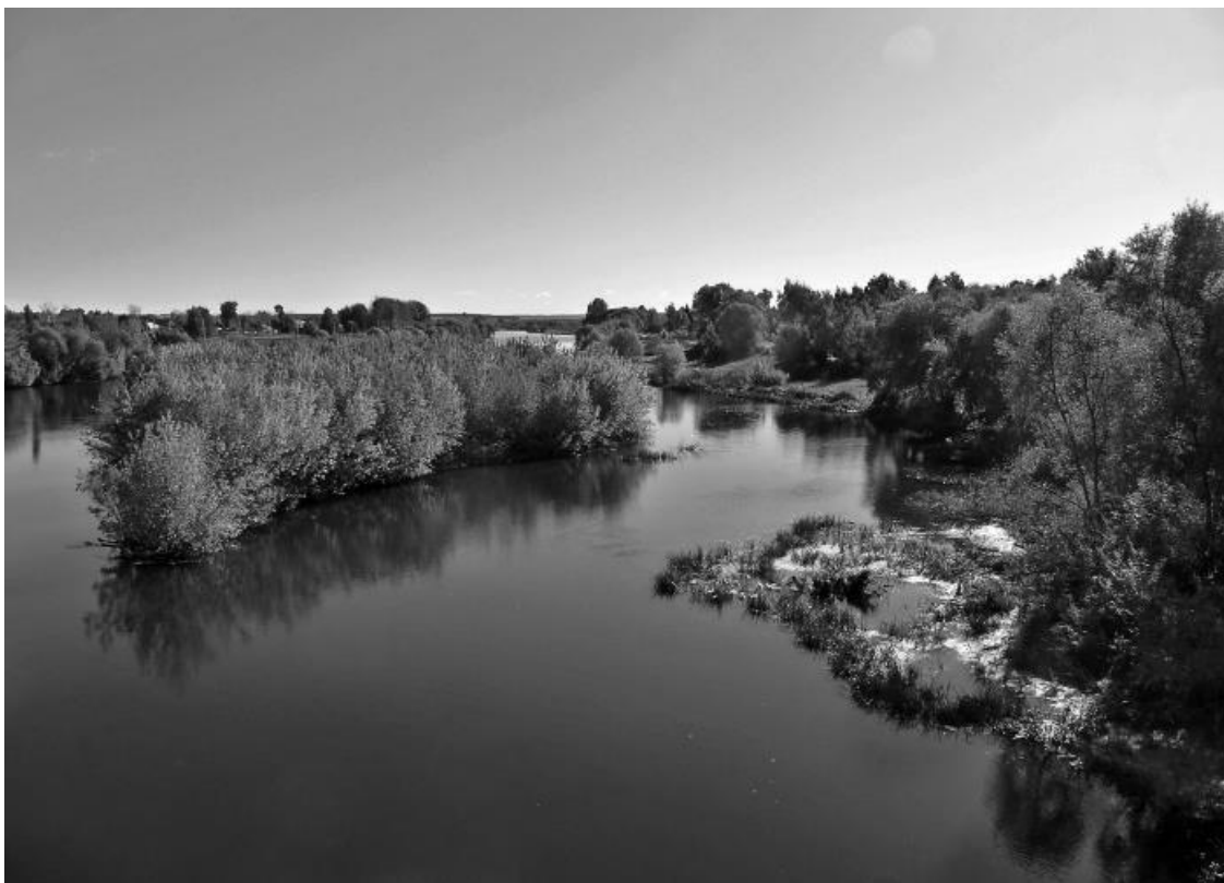
Берег Дона в Лебедяни. Сад дома Замятина простирался до берега реки справа