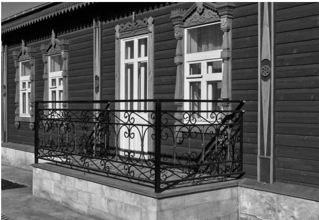
Дом Замятина на Покровской улице в Лебедяни, перестроенный в 2009 году под музей Замятина (фото автора)

В отдельных отрывочных воспоминаниях о своем детстве Замятин описывает себя погруженным в книги, одиноким ребенком, который уже в четыре года гордо зачитывал своим родителям газетные заголовки: чтение и письмо, как и правописание, давались ему «удивительно-легко, инстинктивно» 7 .