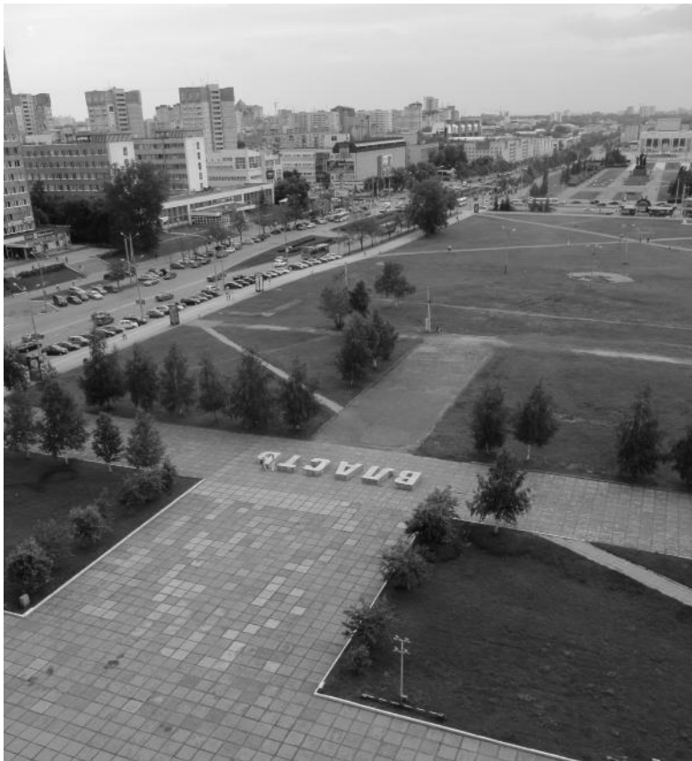
Илл. 1. «Власть» Н. А. Ридного, инсталляция, установленная в 2010 году перед зданием Пермского законодательного собрания, в конце эспланады в центре города. Штаб-квартира компании «ЛУКОЙЛ-Пермь» находится за кадром слева. Фото автора, 2010