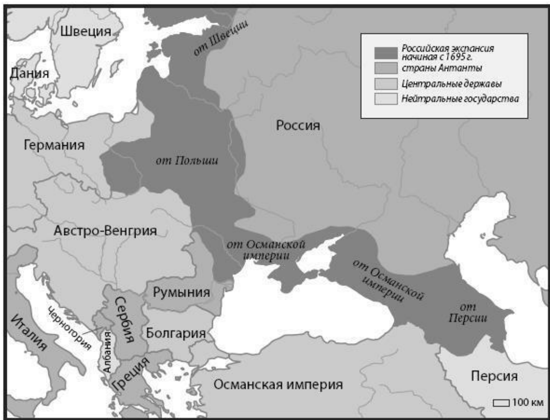
Карта 1. Имперские окраины в Восточной Европе

История государств рассказывает лишь часть истории этих имперских окраин. Социальная динамика в регионе имела ничуть не меньшее значение. Классовая, религиозная и этническая принадлежность образовывали самые неожиданные переплетения. Очень часто дворянство и крестьянство говорили на разных языках. Германские землевладельцы в Балтийском регионе управляли государствами, населенными латышами, эстонцами и литовцами. Польские феодалы владели украинскими крепостными, русские дворяне-колонизаторы в XIX веке эксплуатировали польское крестьянство, и даже в России дворяне охотнее говорили на французском языке, чем на языке своих крепостных.