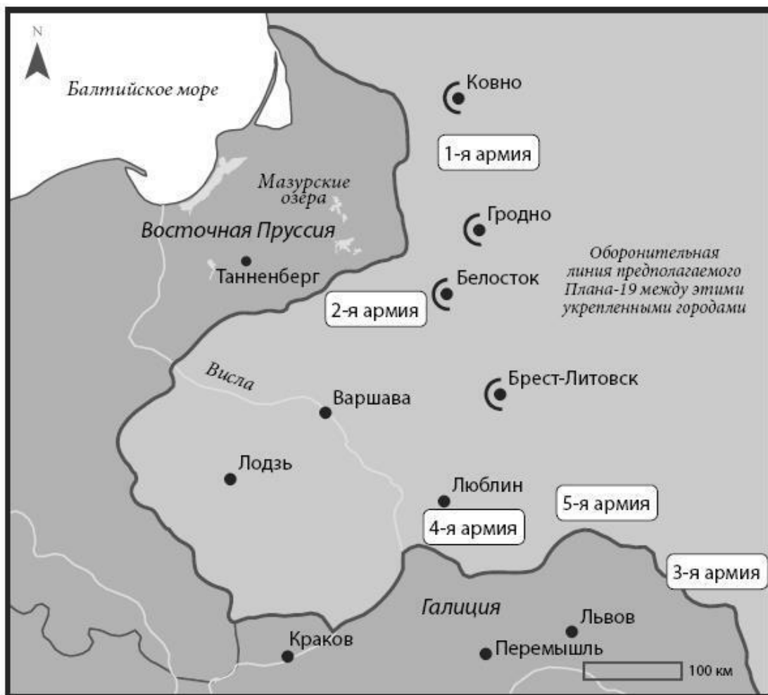
Карта 2. Русские войска в Польше. План 19 и 19 А

Война началась согласно плану. Две армии осторожно испытывали друг друга первые несколько дней, пока империи перебрасывали миллионы солдат в зону военных действий. Каждая сторона посылала разведчиков через границу для сбора сведений; происходили мелкие столкновения. Немецкие войска предпринимали походы вниз по течению Вислы, русская кавалерия предприняла несколько вылазок, случилось несколько стычек между патрулями [Богданович 1964: 45; Кпox 1921, 1: 41].