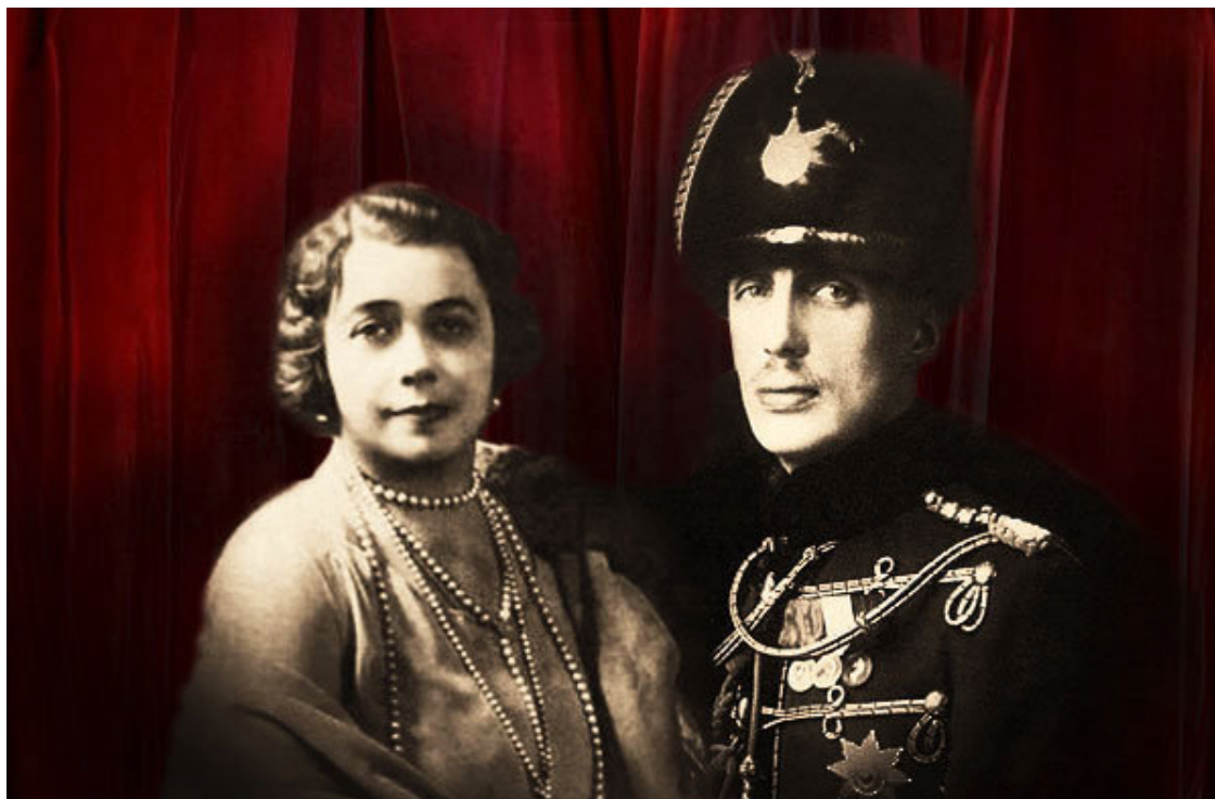
Антонина Нестеровская и князь Гавриил Константинович

В марте 1918 года его, как и всю семью Романовых, арестовали. Было понятно, что ничего хорошего в данных обстоятельствах его не ждет. Но Ниночка не хотела так просто отказываться от мужчины, который благосклонно к ней отнесся и бескорыстно ее полюбил.