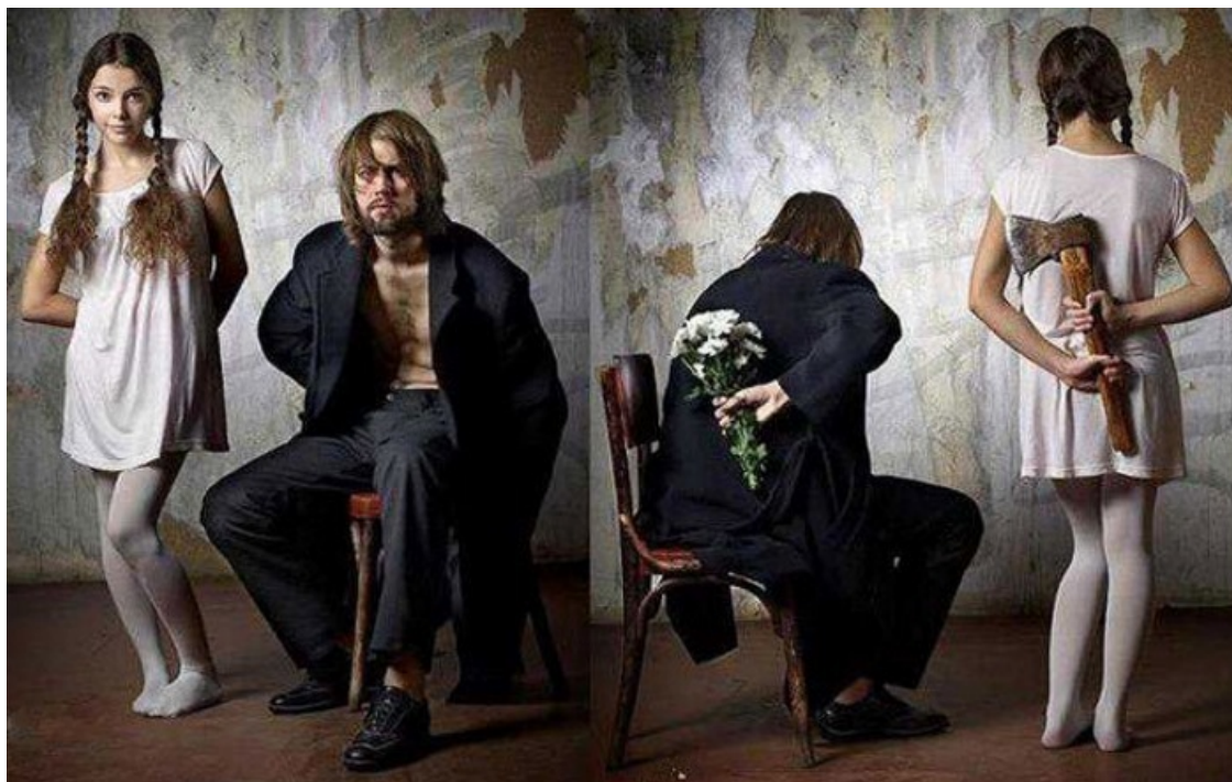
Искажение восприятий. «Эффект ореола»

Проблема неверного восприятия человеческих качеств, чувств и намерений намного серьезнее, чем кажется на первый взгляд. Эту простую истину познала на практике прекрасная и рациональная Мэри Элеонора Боуз.