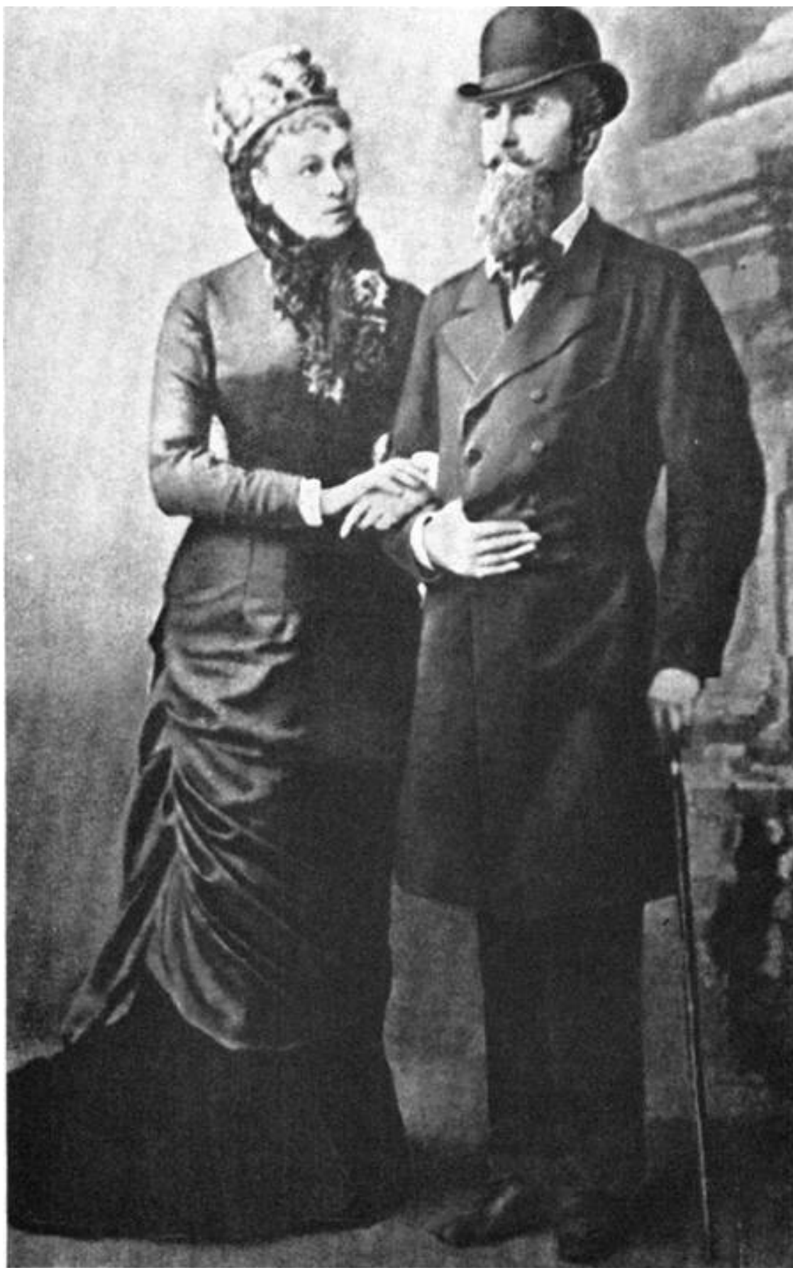
Наталья Пушкина-Дубельт и Николай Вильгельм Нассауский