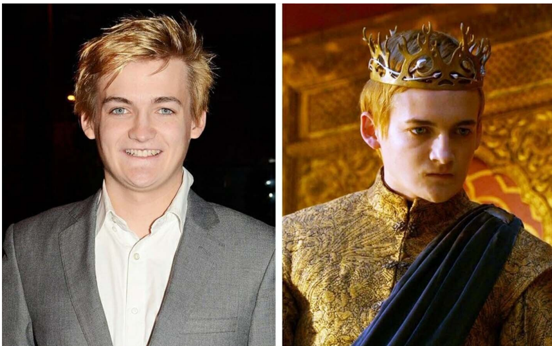
Актер Джейк Гилсон

Именно из-за «эффекта ореола» разнообразным «бизнес-тренерам» и прочим «гуру» так легко убедить аудиторию в своем личном успехе и богатстве. Именно поэтому многие люди влюбляются и боготворят совершенно не стоящих любви и преклонения людей.