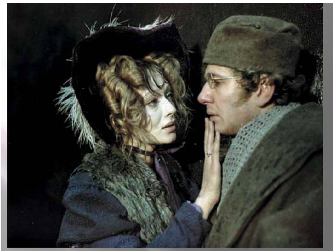
Кадр из фильма «Звезда пленительного счастья»

Владимир Мотыль своими действиями не только помог актеру стать знаменитым, но и существенно повысил его профессиональные навыки. Дуэт Игоря Костолевского и Эвы Шиккульской позднее назовут одним из самых удачных в картине.