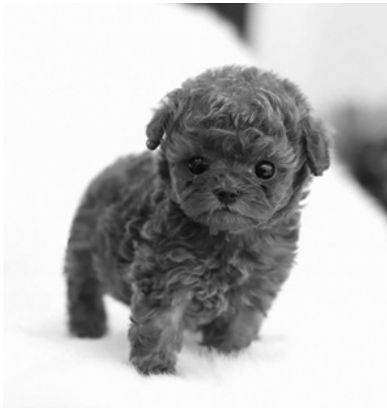
Ил. 3. Сырок (Cheese), пудель стандарта teacup. В 2018 году был выставлен на продажу на сайте одного из южнокорейских зоомагазинов

Исследуя понятие трогательности, Бойл и Као связывают его с такими характеристиками, как мягкость, округлость, инфантильность, женственность, беспомощность, уязвимость, безвредность, игра, удовольствие, неловкость, потребность в заботе и внимании, интимность, домашний уют и простота, а также с качествами, которые могут оцениваться как негативные; незрелостью, легкомыслием, зависимостью, потенциалом для манипуляции и ориентацией на иерархические отношения 88 . Некоторые из этих характеристик поощряют интенсивный тактильный контакт, другие – сравнение животных с маленькими детьми. Несколько респондентов Плурд признались, что им нравится позиционировать себя в качестве покровителей своих фаворитов – чувствовать зависимость кошек от знаков внимания. Эстетика каваяи побуждает нас строить с животными-компаньонами отношения, основанные на антропоморфных проекциях, вместо того чтобы изучать особенности вида и наблюдать за повадками конкретных особей. Для понимания истоков этой тенденции нам стоит познакомиться с Сырком.