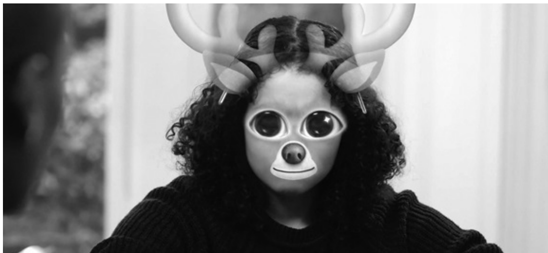
Ил. 2. Кадр из сериала «Годы» ( Years and Years ), эпизод 1. Совместное производство BBC One и HBO

эпизодов сериала девочка-подросток во время завтрака с родителями активирует голографическую маску с эмодзи оленя, а после сообщает им о своем желании отказаться от физического тела и загрузить себя в сеть (ил. 2) 60 .