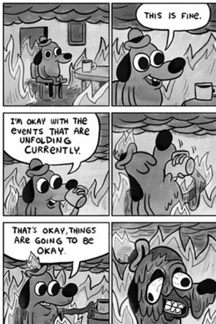
Ил. 1. Кейси Грин (KC Green). «В огне», вебкомикс из серии Gunshow, 2013. В 2014 году после публикации первых двух кадров комикса на Reddit он стал популярным мемом, а выражение «Все в порядке» (This is fine) приобрело противоположный смысл.

Сегодня привычные модели жизни и работы устаревают раньше, чем формируются новые. В результате стремление к традиционным компонентам благополучия – приобретению квартиры, достижению высокого профессионального статуса, созданию семьи – становится препятствием для осознания и удовлетворения собственных интересов. Преследование недостижимых показателей успеха рано или поздно приводит к эмоциональному истощению, развитию тревожности и депрессии. Жилплощадь, зарплата, отношения – все три стереотипных слагаемых счастья удастся собрать немногим. Между тем именно просторная квартира, высокая зарплата и семья обеспечивают возможность содержать крупную собаку и достойно ухаживать за ней в течение 15–18 лет, летая при этом в командировки и работая на износ. В квартирах одиноких жестоких оптимистов выживают лишь удобные животные – незаметные и легкие в уходе. Они не требуют внимания, когда их опекуны заняты, в то же время помогают переживать стресс, если человек инициирует контакт – а к нему они всегда расположены.