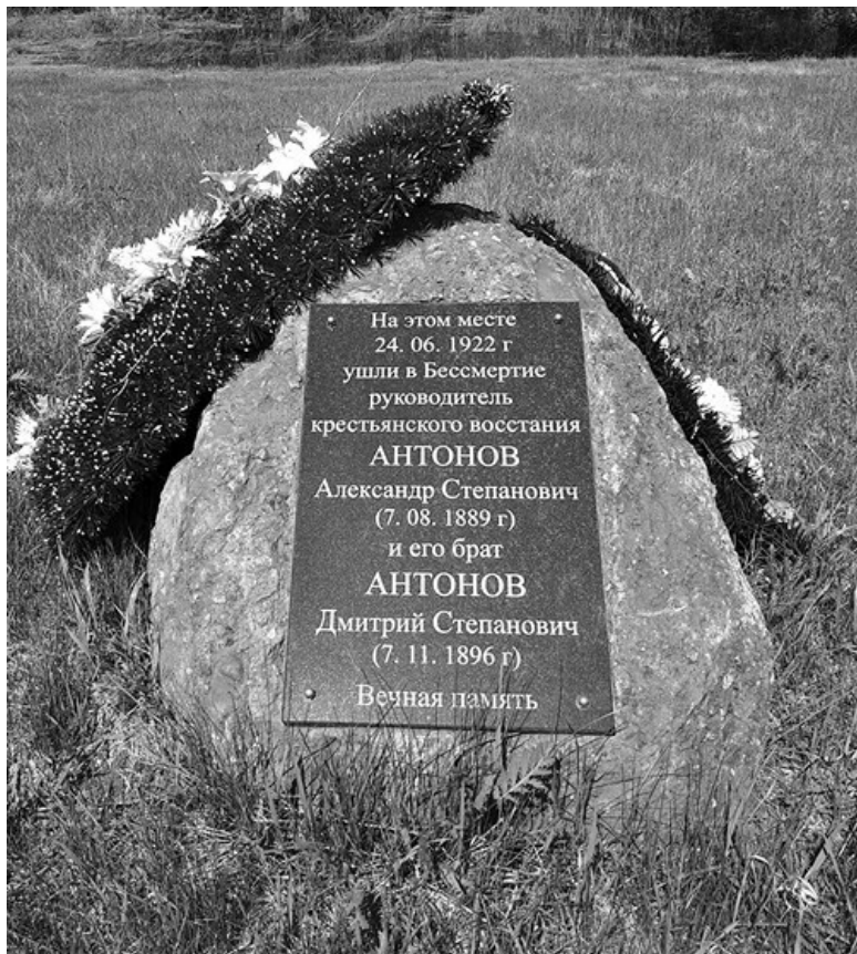
Ил. 4. Камень на месте убийства Александра Антонова и его брата Дмитрия на окраине села Нижний Шибрай, установленный в 2017 г.