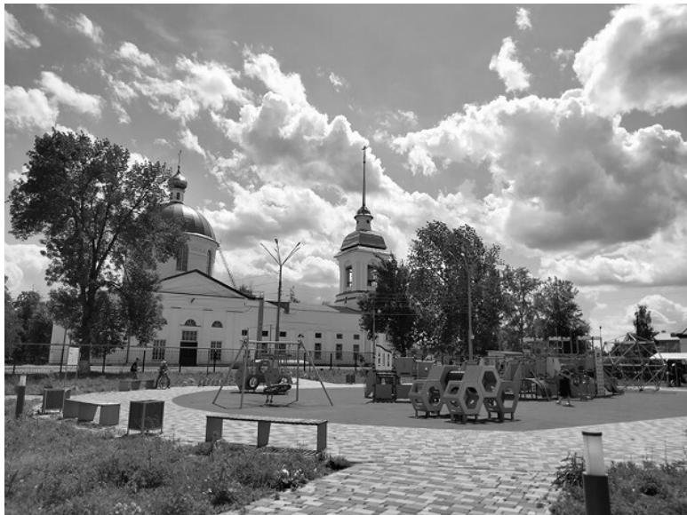
Ил. 4. Территория вокруг Христорождественского собора после реконструкции. 2022 г.