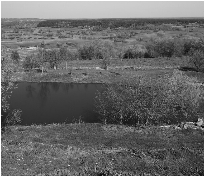
Ил. 2. Заливные луга вокруг реки Вороны около села Карандеевка.

деле. Если кирпичи – это как бы символ какой-то красноармейцам, то камень – это дух реальный 77 .