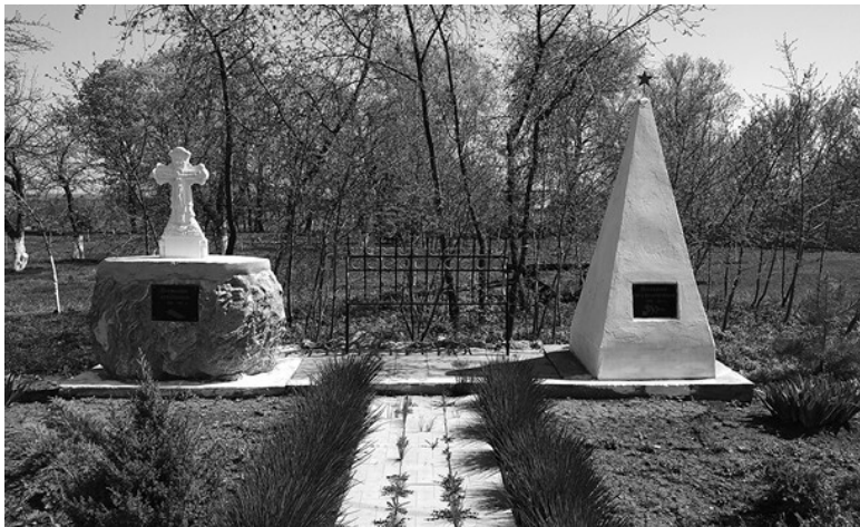
Ил. 3. Памятники крестьянам (слева) и красноармейцам (справа) в селе Карандеевка во дворе отеля «Русская деревня».

Стоит отметить, что местные жители восприняли этот рассказ скептически, в существовании «летучек» восставших усомнились и предположили, что легенда придумана Н. С. в расчете на посещающих Карандеевку туристов.