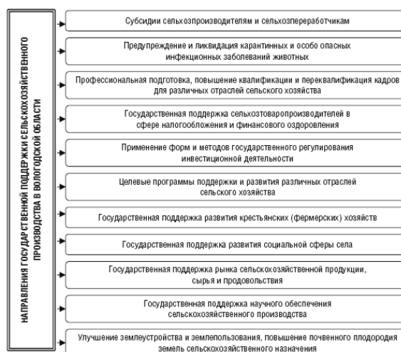
Рисунок 1.5. Направления государственной поддержки сельскохозяйственного производства в Вологодской области

Основным нормативным актом, определяющим направления развития АПК в Российской Федерации, является «Государственная программа развития сельского хозяйства и регулирования рынков сельскохозяйственной продукции, сырья и продовольствия на 2008 – 2012 годы» (далее – Госпрограмма). В соответствии с этим документом между Департаментом сельского хозяйства, продовольственных ресурсов и торговли области и Минсельхозом РФ было заключено Соглашение. В нем определены целевые показатели развития АПК и сельских территорий региона, перечень мероприятий и их ресурсное обеспечение.