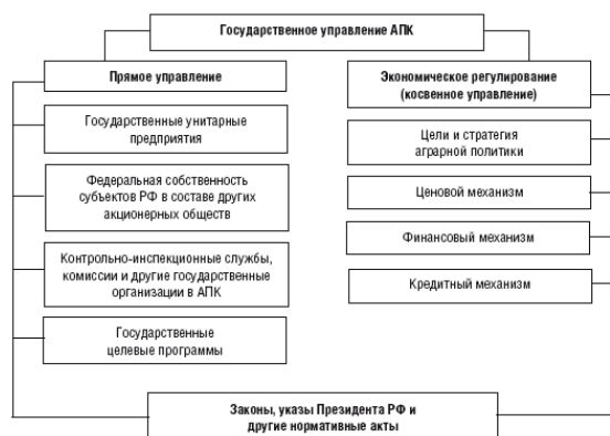
Рисунок 1.3. Модель государственного управления АПК [25]

Перспективы развития регионального АПК в значительной степени зависят от выбора целевых ориентиров агропродовольственной политики, адекватности и своевременности использования форм и инструментов ее реализации. В результате формирования в России рыночной модели хозяйствования произошел переход от прямого к косвенному государственному управлению во всех сферах экономики, в т. ч. и в агропромышленном комплексе. Таким образом, регулирование функционирования отраслей АПК свелось преимущественно к определению целей и стратегических ориентиров аграрной политики, а также выработке ценового, финансового и кредитного механизмов (рис. 1.3).