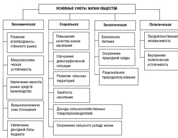
Рисунок 1.1. Роль АПК в экономике (составлено по И.Г. Ушачеву [81])

Роль агропромышленного комплекса в экономической, социальной, экологической и политической жизни общества очень велика (рис. 1.1). Состояние АПК во многом определяет уровень продовольственной безопасности (самообеспеченности) региона, его политической и экономической устойчивости. Сельское хозяйство имеет огромное значение в обеспечении населения качественными продуктами питания, сохранении природной среды. Устойчивое развитие сельских территорий, где проживает около 30 % населения страны, является основой сохранения историко-культурного потенциала российской деревни, улучшения демографической ситуации, снижения безработицы и социальной напряженности, повышения уровня и качества жизни.