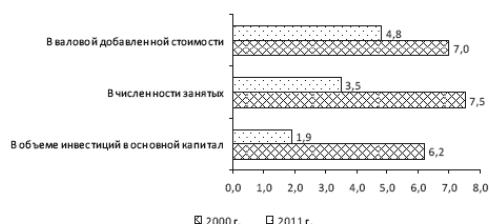
Рисунок 1.6. Доля сельского хозяйства в основных показателях экономики Вологодской области, %

В последнюю пятилетку вопросы развития аграрного сектора экономики стали рассматриваться российской властью всех уровней как приоритетные. Осуществлялся национальный проект «Развитие АПК», трансформировавшийся в Госпрограмму, были приняты Федеральный закон «О развитии сельского хозяйства», Федеральная целевая программа «Социальное развитие села до 2012 года», Доктрина продовольственной безопасности, Концепция устойчивого развития сельских территорий на период до 2020 года, другие федеральные и региональные программы. Благодаря корректировке аграрной политики на федеральном уровне, реализации органами власти области ряда мер по поддержке агросектора удалось приостановить разрастание в нем кризисных процессов. Но многообразные факторы, сдерживающие переход к быстрому и устойчивому подъему сельской экономики, продолжают действовать. За 2000–2011 гг. доля сельского хозяйства в основных показателях экономики Вологодской области сократилась: в валовой добавленной стоимости – с 7 до 4,8 %, в численности занятых – с 7,5 до 3,5 %, в объеме инвестиций – с 6,2 до 1,9 % (рис. 1.6). Это свидетельствует о более высоких темпах развития других отраслей народного хозяйства региона.