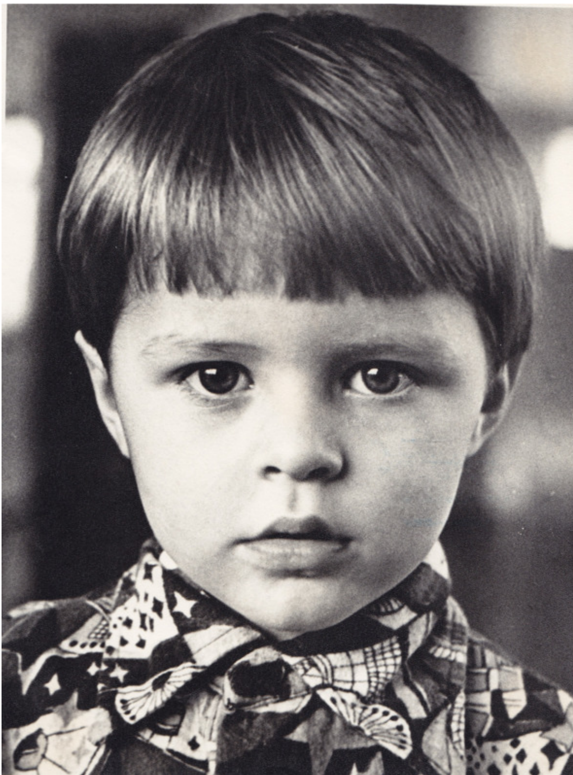
детская фотография, 1977г