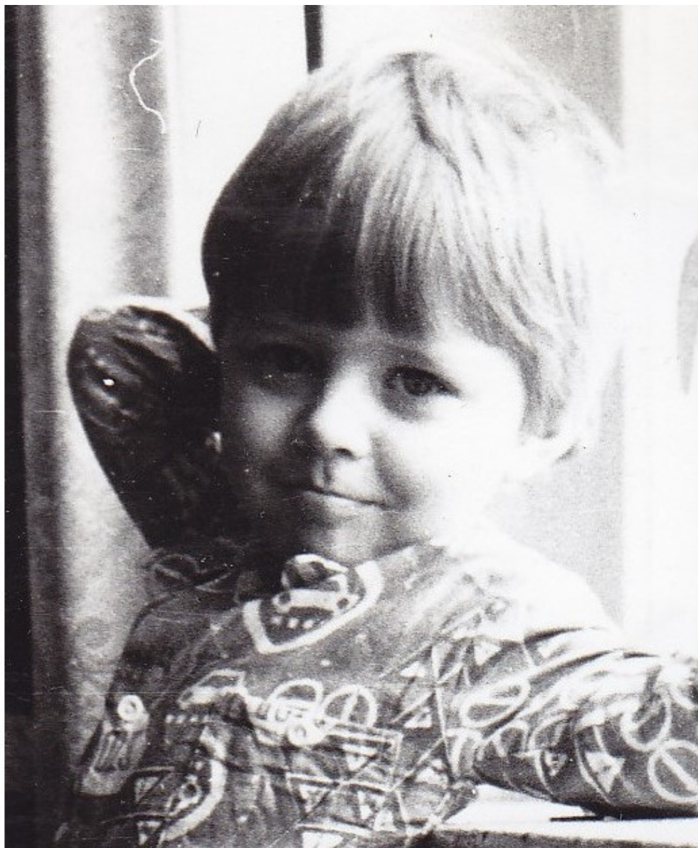
детская фотография, 1978—79гг